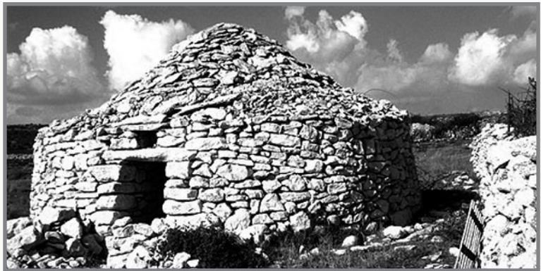
Penetta fuq il-gżira Taljana ta' Sardinja