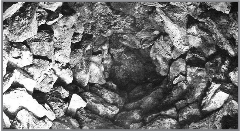
L-intern ta' girna, fejn jidher sew il-ħajt u s-saqaf

Tajjeb li dawn l-binijiet b'stil uniku u b'karatteristika rustika jiġu mħarsa aktar aħjar u jistgħu jintużaw anki biex jiġu aktar esploraturi kemm mill-generazzjoni li tielgħa u anki mit-turisti li jżuruna. Jalla persuni oħra jsegwu l-passi ta' Patri Mikiel Fsadni u jidhlu aktar fid-dettall fl-istudju fuq il-giren. Studju aktar fid-dettall, jista' jwassal biex jinxtehet aktar dawl fuq il-konnesjoni li jista' jkun hemm bejn l-għerejjex li nbnew mill-ewwel Maltin biex abitaw fihom wara l-għerien, it-tempji Megalitiċi li hemm xebh ma' kif inhuma mibnija l-giren u anki l-possibilità ta' konnessjoni bejn l-għeruq ta' diversi forom ta' giren li jinstabu f'diversi pajjiżi speċjalment f'pajjiżi li xtuthom huwa maħsul mill-baħar Mediterranju.