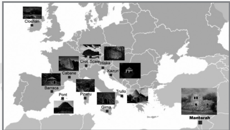
Mappa ta' fejn jinsabu diversi tipi ta' giren fl-Ewropa u fil-Lvant Nofsani