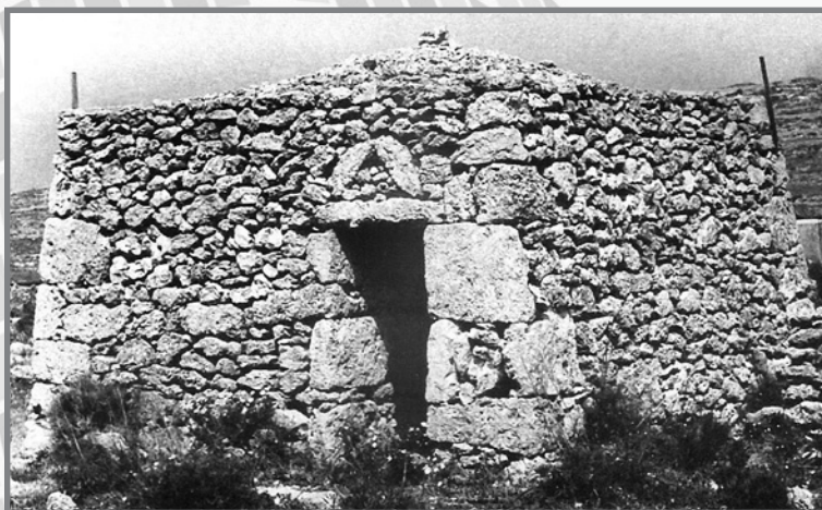
Girna ta' ċertu daqs fix-Xagħra l-Hamra

Patri Fsadni fl-istudju tiegħu fir-riċerka li għamel waqt li jagħmel analiżi ta' dawn il-giren, huwa