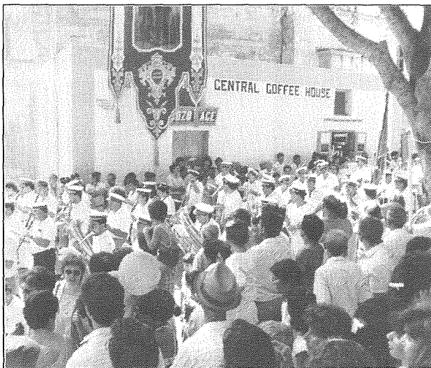
Il-Banda La Vittoria tferraħ l-Għawdxin u lit-Turisti, fil-Festa ta' Santa Marija.

Wara li ntemmet il-gwerra nergħu nsibu lil banda 'La Vittoria' tieħu sehem fil-festa ta' Santa Marija ta' l-1944 meta hadet sehem lejlet il-festa, 6 waqt li fl-1945 l-banda 'La Vittoria' hadet sehem nhar it-12 ta' Awissu, u ghamlet marċ mal-banda 'Leone' li fih kienet ingarret l-istatwa ta' Santa Marija mil-Vajringa, l-post fejn kienet tinżamm din l-istatwa, sat-Tokk, fejn tpoġġiet fil-knisja ta' San Ġakbu. 7 Sehem ukoll hadet il-banda 'La Vittoria' fil-festa ta' Santa Marija ta' l-1960 u ta' l-1961 meta ghamlet marċi matul triq it-Tigrija, llum triq ir-Repubblika, u wara esegwiet programm mużikali fit-Tokk. 8