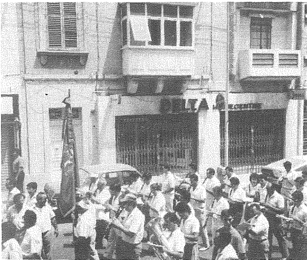
Il-Banda La Vittoria fit-Tokk, Ghawdex waqt il-Marc ta' filghodu.

Fost l-affarijiet li ghamlet is-Socjetà Filarmonika 'Leone' f'dan ir-rigward kien li bdiet tistieden baned ohra sabiex flimkien mal-banda Cittadina 'Leone' jkabbbru bid-daqq ferrieħi tagħhom il-festi esterni ta' Santa Marija. Tnejn minn dawn il-baned kienu iż-żewġ baned Mellehin, jiġifieri, l-banda 'La Vittoria' u l-banda 'Imperial'.