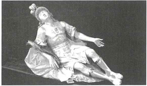
Korp Sant ta' San Kostantinu