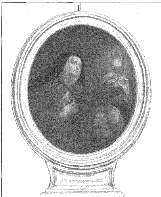
Kwadru Santa Klara

Kien waqt l-istess Viżta Pastorali tal-1789 li l-Kapitlu Elenjan ressaq petizzjoni lill-Isqof Labini. Fiha espona li kien hemm persuna devota li kienet lesta li tagħmel a spejjeż tagħha, kwadru ta' Santa Klara, biex jitqiegħed fuq l-altar tal-Immakolata Kuncizzjoni. Għal dan il-għan, din kienet lesta ċċedi favur l-istess qaddisa u l-altar, mal-hamsa u għoxrin skud applikat f'kapital bollali, bl-interess ta' sitta fil-mija li kienu rreġistrati fl-Atti tan-Nutar Felic Grech tal-31 ta' Lulju 1789. Dan kien ser jingħata bl-obbligu li kull sena, mill-interess tal-istess kapital, issir Quddiesa kantata fil-festa ta' Santa Klara. Izda f'każ li maż-żmien dan il-kapital jintilef, l-obbligu marbut miegħu kien jispicċa. Għaldaqstant, il-Kapitlu Elenjan talab lill-Isqof biex jagħtihom il-fakultà li jaċċettaw din l-ghotja. L-Isqof Labini ta l-kunsens tiegħu fit-22 ta' Dicembru 1789 waqt l-istess Viżta Pastorali. 6