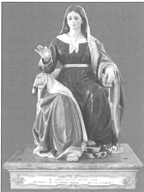
L-istatwa l-qadima tal-Madonna tad-Duttrina li illum tinsab fil-Knisja l-Qadima ta' Birkirkara

Din id-deliberazzjoni Kapitulari tindika żewġ affarijiet. L-ewwel nett li din il-festa kienet diġà qiegħda ssir fil-bidu tas-snin tletin tas-Seklu Dsatax. It-tieni jidher li din il-festa kienet qiegħda tgawdi ċerta popolarità biex giet elevata għall-festi Prepositali. Għall-istorja nixtiequ nżidu li l-festa tal-Madonna tad-Duttrina baqgħet festa Prepositali sal-1996. 63