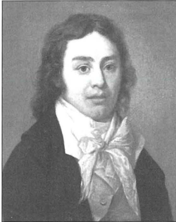
Samuel Taylor Coleridge