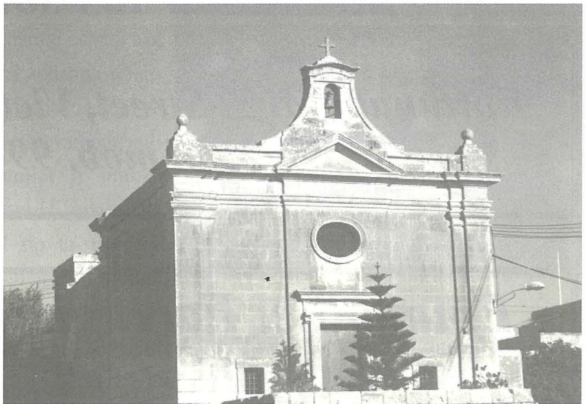
Il-knisja ta' Ghajn Rihana

Qrib is-snin 1866-1882 saret kamra ġdida bħal kċina biex ikun jista' jithejja l-ikel għall-pelegrini nhar il-festa kif stabbilit mill-fundatur, mela nhar l-20 ta' Lulju.