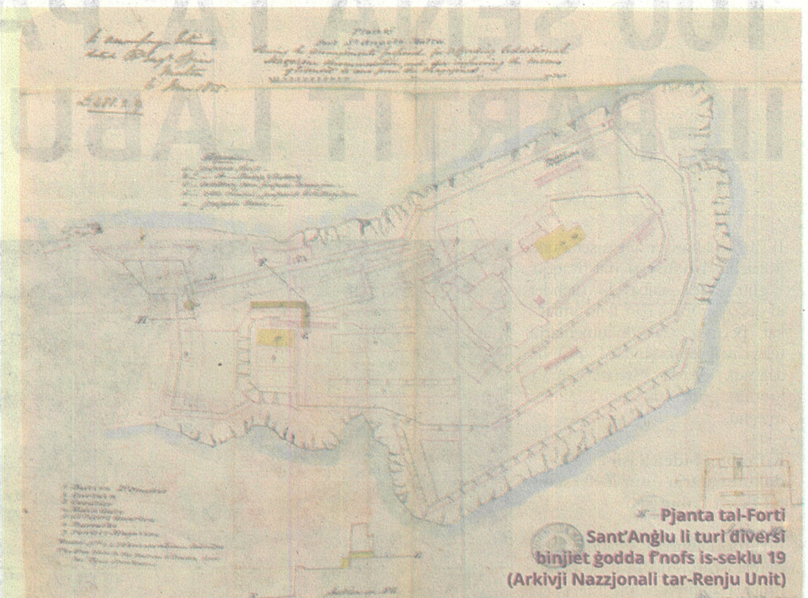
Pjanta tal-Forti Sant'Anġlu li turi diversi binjiet godda f'nofs is-seklu 19

Fil-fatt, jista' jkun li kien dan in-nuqqas ta' importanza li wassal sabiex fl-1887 bdiet it-tradizzjoni li viżitaturi ċivili jithallew iżuru l-fortizza nhar is-7 u t-8 ta' Settembru sabiex tiġi mfaktra r-rebħa tal-Assedju l-Kbir, liema tradizzjoni għadha għaddeja sal-lum il-gurnata. L-aħħar daqqa fuq l-użu militari tal-Forti Sant'Anġlu waslet fl-1898 hekk kif kull artillerija u kanuni li kien għad fadal, gew proposti li jitneħħew u b'hekk, prattikament il-fortizza ma setgħetx tintuża aktar f'xi gverra. Biss, għalkemm dan forsi wassal għall-biza' li l-Forti Sant'Anġlu jiġi abbandunat, dan ma kienx il-każ, peress li fl-istess żmien il-Flotta Rjali kienet qed tkabbar il-preżenza tagħha f'Malta u dejjem kellha bżonn ta' iktar facilitajiet għall-użu tagħha. B'hekk, il-Forti Sant'Anġlu għadha għall-aħħar użu militari tiegħu li kellu jtawwal proprju sat-tluq tal-aħħar Forzi militari barranin mill-Gżejjer Maltin fl-1979.