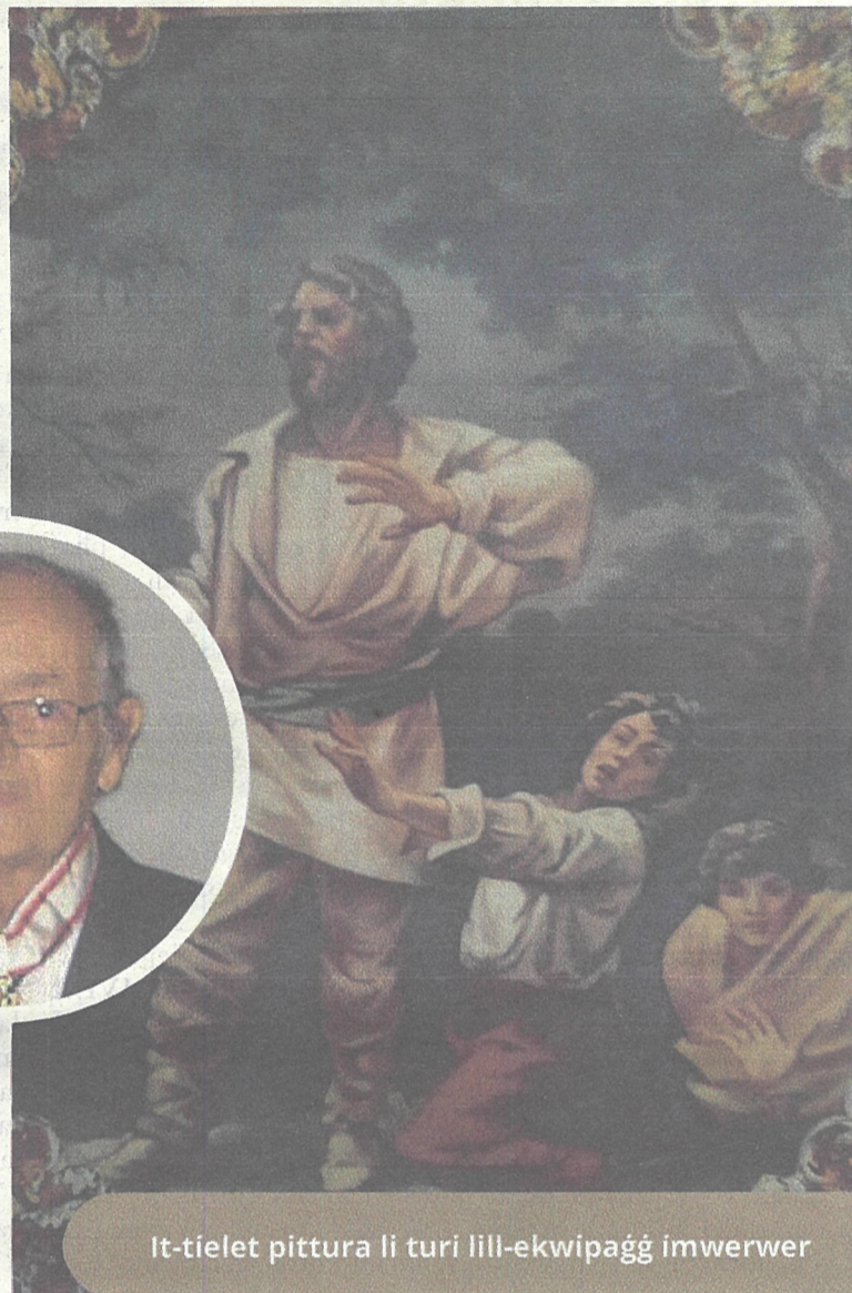
It-tielet pittura li turi lill-ekwipaġġ imwerwer

wieċu jilma l-hena, wiegħbu li kien għadu kif holom holma ta' hlewwa liema bhalha. Fiha kellu vizjoni ta' mara, li qalb dija li tghammex kienet qed iżżomm fuq dirgħajha gmiel ta' tarbija u fuq fommhom tbissima tas-sema. Komplja jirrak-kuntalu li waqt id-dehra, dehxa ta' hena griet ma' gismu kollu u xtaq li ma tispicċa qatt, għax kien konvint li dik il-mara ma kienet hadd hlief Ommna Marija Santissima b'Gesù Bambin f'idejha!