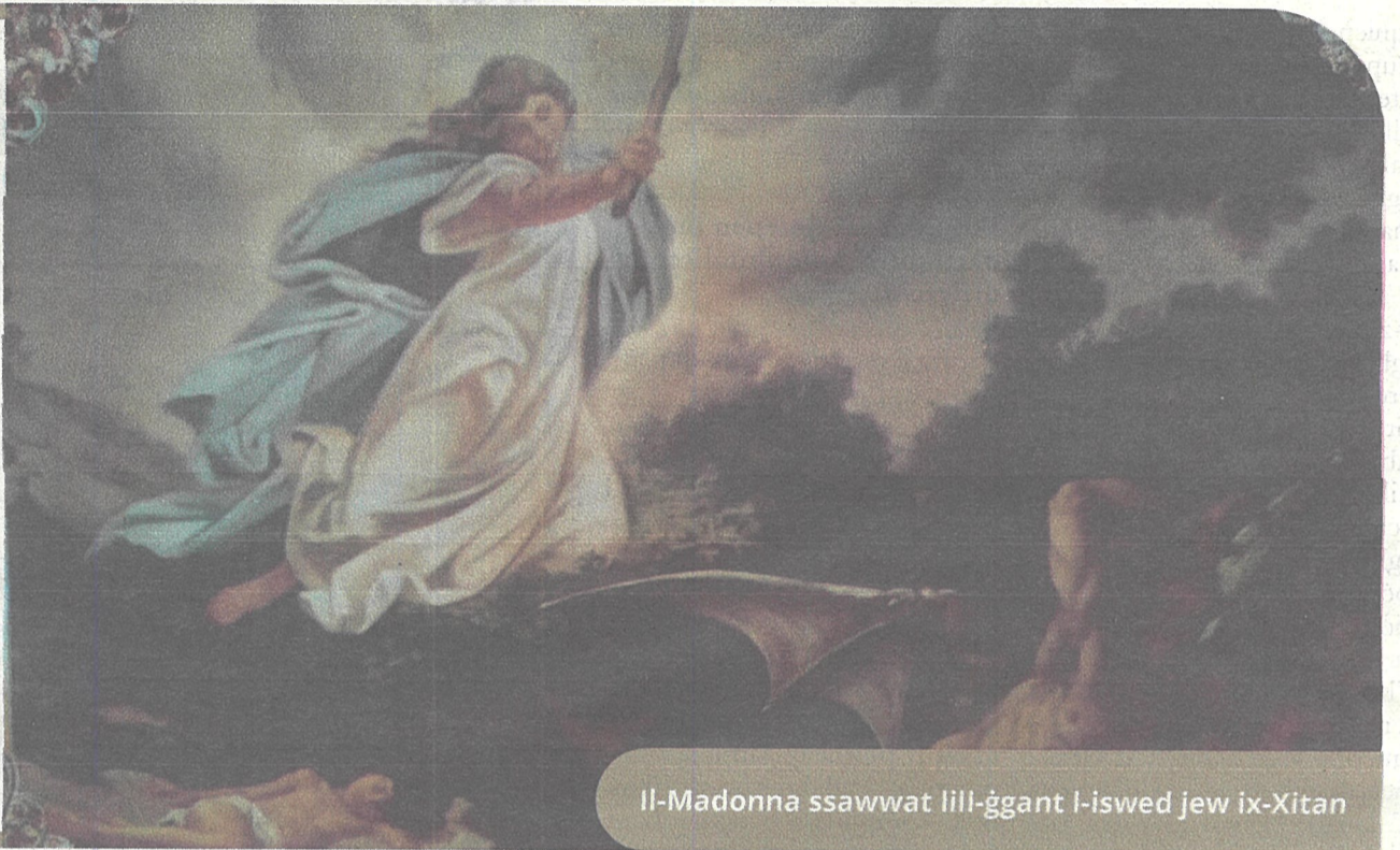
Il-Madonna ssawwat lill-ġgant l-iswed jew ix-Xitan

Salvator, ninzlu niżla lejn Bormla, fejn leggenda helwa tirrakkonta grajja marbuta mal-ġgant iswed! Fiex tikkonsisti din il-leggenda?