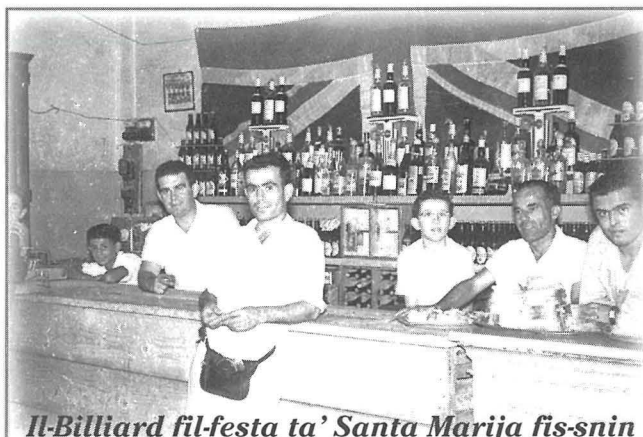
Il-Billiard fil-festa ta' Santa Marija fis-snin hamsin tas-seklu għoxrin

Ikla tajba, biċċa dullieġha, xarba nbid għall-kbar u f'it luminata għat-tfal, f'it tpaċpiċ u xi żewġ sigaretti u nagħsa ħelwa fis-sħana ta' Awissu. Il-kbar dejjem. Għax aħna la konna npejpu d-dar u l-anqas norqdu wara nofsinhar. Il-festa konna rridu ngawduha allura