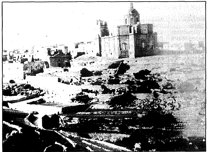
Dehra ta' madwar il-knisja.