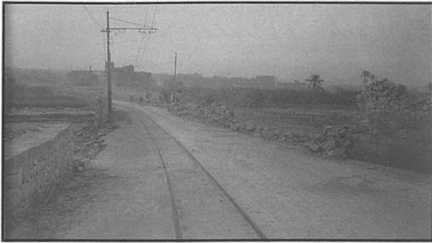
Xellug - ritratt tal-linji tat-tramm fuq tal-pont ta' Hdejn l-Erba' Qaddisin