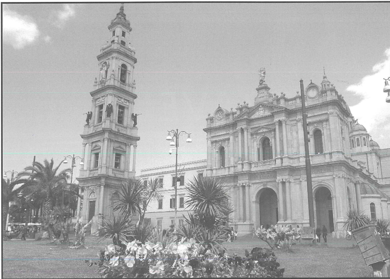
Is-Santwarju tal-Madonna ta' Pompei ġewwa Pompei, fl-Italja