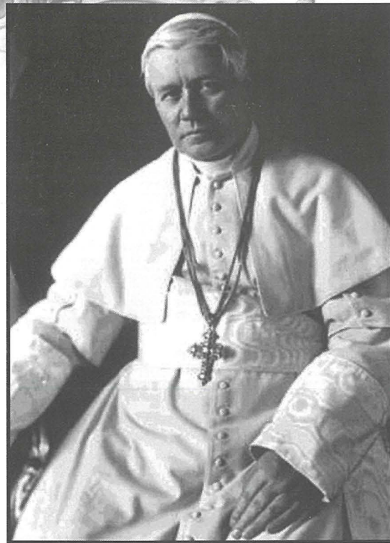
Il-Papa San Piju X li ħatar is-Santwarju bhala wieħed Pontifiċju.

Bħalma tistgħu tinnotaw, id-data tat-tqeghid tal-ewwel ġebli tas-santwarju nhar it-8 ta' Mejju 1876, kienet data importanti ħafna, għax dakinhar ufficialment bdiet il-ħidma tat-tixrid tad-devozzjoni lejn Ommna Marija taht it-titlu tar-Rużarju Mqaddes u kif ukoll għall-ħidma soċjali ġewwa l-belt ta' Pompei. Ma rridux ninsew li l-belt ta' Pompei kienet maħkuma minn ħażen kbir u li n-nies kienu warrbu lil Alla kompletament. Imma permezz tal-ħidma tal-lajk Dumnikan Bartolo Longo, il-belt inbiddlet minn waħda pagana għal waħda Marjana. Huwa propju għalhekk li l-Knisja Kattolika għażlet il-gurnata tat-8 ta' Mejju biex tiġi ċelebrata l-festa tal-Madonna ta' Pompei u għalhekk fil-parroċċa tagħna kull sena naghmlu l-Pellegrinaġġ f'ġieħ Ommna Marija ta' Pompei. Il-Pellegrinaġġ kien bdieh il-Kappillan Dun Lawrenz Mifsud fit-8 ta' Mejju tal-1963.