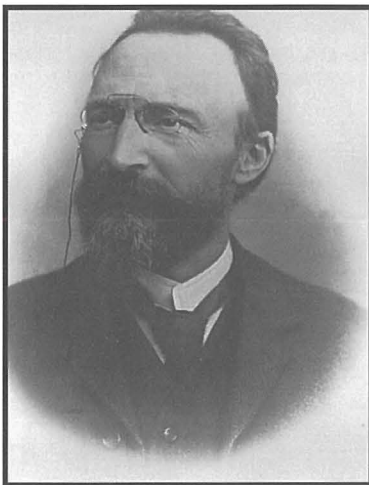
Il-Beatu Bartolo Longo

Bhala Parrocċa, jekk Alla jrid, nhar it-8 ta' Mejju 2013 niċcelebraw il-50 Anniversarju mill-bidu tal-Pellegrinaġġ Nazzjonali tal-Madonna ta' Pompei. Jiena mhux ħa nitkellem fuq il-pellegrinaġġ innifsu, imma fuq l-ewwel ġrajja li seħhet f' Pompei nhar it-8 ta' Mejju. Permezz ta' dan l-artiklu ser nispjega għalfejn intagħżel il-jum tat-8 ta' Mejja bhala l-festa liturgika tal-Madonna ta' Pompei.