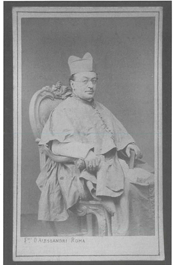
Il-Kardinal Raffaele Monaco La Valletta li ikkonsagra s-Santwarju f'isem il-Papa Ljun XIII

Kien fit-8 ta' Mejju ta' l-1887 meta ġie kkonsagrat l-artal tas-santwarju ġdid iddedikat lill-Madonna tar-Rużarju ġewwa Pompei. Barra l-artal, ġie kkonsagrat ukoll it-tron ta' fejn kellha titqiegħed ix-xbieha mirakoluża tal-Madonna. Dakinhar stess ukoll bdiet il-ħidma soċjali ġewwa Pompei, kif ukoll ġie nawgurat l-orfanatrofju għat-tfal. Is-Santwarju kien ġie kkonsagrat nhar is-7 ta' Mejju tal-1891, meta ġie fit-tmiem il-bini kollu tas-santwarju mir-rappreżentant tal-Papa Ljun XIII, il-Kardinal Raffaele Monaco La Valletta. Meta sar il-bini tas-santwarju, id-devozzjoni lejn il-Madonna tar-Rużarju ġewwa Pompei bdiet tikber b'pass mgħaġġel fl-Ewropa kollha. Għalhekk kulhadd beda jirreferi għax-xbieha mirakoluża bhala l-Madonna ta' Pompei. Il-Papa Ljun XIII, meta ra li l-ħidma soċjali ġewwa Pompei bdiet tikber u li d-devozzjoni lejn il-Madonna tar-Rużarju