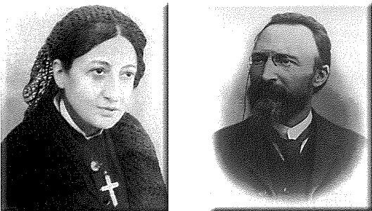
Santa Keterina Volpicelli u l-Beatu Bartolo Longo