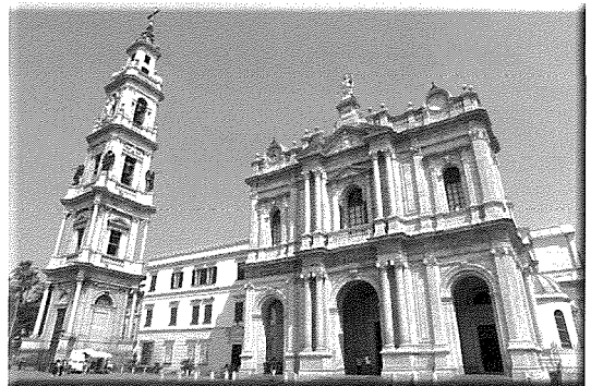
Il-faċċata maestuża tas-Santwarju tal-Madonna ta' Pompei fl-Italja

Minħabba li x-xogħol fl-orfanatrofji kien kiber, Longo talab l-għajnunja u għalhekk ġew għajnuħ xi sorijiet Dumnikani. Eventwalment, Longo waqqaf il-Kongregazzjoni tas-Sorijiet Dumnikani tar-Rużarju ta' Pompei nhar il-25 t'Awwissu 1897. Dawn is-Sorijiet mill-ewwel middew idejhom għax-xogħol; min jgħallem, min jgħin fil-karità u min jieħu ħsieb l-artal u l-armor tiegħu.