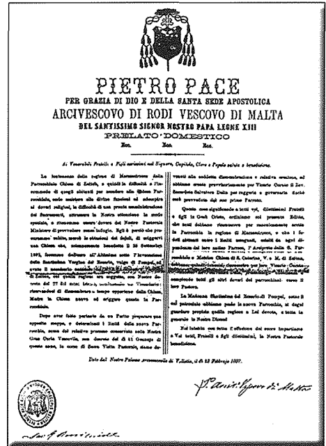
Id-digriet tal-Isqof Pietru Pace

Marsaxlokk sar Parroċċa awtonoma, iddedikata lill-Madonna tar-Rużarju ta' Pompei b'digriet tal-Isqof Pietru Pace nhar il-11 ta' Jannar 1897.