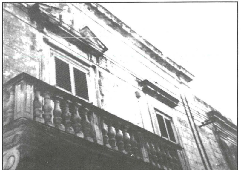
Il-Gallarija ta’ Casa Perellos fiż-Żejtun

Xhieda oħra tar-rabta li Perellos kellu maż-Żejtun, tidher fil-knisja ta’ San Girgor. Din il-knisja parrokkjali qadima ġiet imkabbra u mżejna fi żmien il-Kavallieri. Hekk il-kappelluni kienu nbnew bejn is-snin 1593 u 1603, kif jidher mir-ruġuni li qegħdin fis-saqaf tagħhom. Wara l-attakk tat-Torok fuq iż-Żejtun fl-1614, il- Gran Mastru Alofju Wignacourt irregala lil din il-knisja , bħala tifkira, Salib tal-Kavallieri tal-fidda (5), u l-pittur Cassarino pinga l-kwadru tal-martirju ta’ Santa Katarina li illum jinsab fis-sagristija prinċipali tal-knisja parrokkjali tal-lum. Iż-żewġ faċċati, dekorati ħafna fuq stil barokk, tal-artali tal-ġnub fil-knisja ta’ San Girgor, iġibul- arma tal-Gran Mastru Cottoner . Perellos ukoll ma naqasx li jirregala kwadru kbir u sabiħ lil din il-knisja: il-kwadru tal-Madonna tal-Karmnu , li jinsab fil-kappellun tax-xellug. Dan il-kwadru jagħti lemħa lill-pittura ta’ Enrico Reynaud (1692 - 1764), iżda ma nafux fiċ-ċert min kien il-pittur. Fil-parti ċentrali t’isfel (li tinsab moħbija f’it wara l-istatwa ċkejkna tad-Duluri fuq l-ixkaffa ta’ fuq l-artal) hemm l-arma ta’ Perellos . Dan ifisser li kien Perellos innifsu li qabbad u ħallas lill-pittur biex jagħmel dan il-kwadru, li wara hu rregalah lill-knisja ta’ San Girgor. Dan ifisser ukoll li fi żmien meta kienet qed tinbena l-knisja parrokkjali ġdida taż-Żejtun, Perellos kellu wkoll għal qalbu l-knisja ta’ San Girgor!