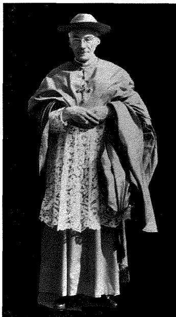
Fig. 22. Il-Kardinal Frings

Dan ma kienx l-uniku kuntatt tal-La Vittoriama' persuni distinti fil-gerarkija ekkleżjastika. Fl-1 ta' Novembru 1966 is-Socjetà kellha vista mill-Kardinal Joseph Frings (Fig. 22.). Is-sena ta' wara s-Socjetà reġa' kellha vista oħramill-Kardinal Marella. L-1967 kienet sena memorabbli għas-Socjetà għax fiha kemm il-Kardinal Marella kif ukoll l-Arcisqof ta' Malta, Mons. Gonzi kienu ntalbu formalment biex jaċċettaw li jsiru patruni tas-Socjetà, invit li kien intlaqa' bil-qalb. (Fig. 23.).