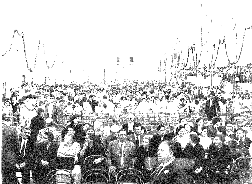
Fig. 17a. Il-folla miġbura fil-pjazza ghaċ-ċelebrazzjonijiet tal-50 anniversarju