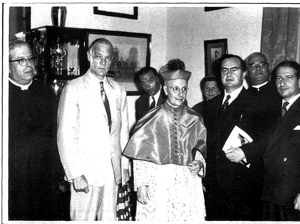
Fig. 18. Il-mistednin distinti waqt ir-riċeviment fil-każin.

Kif spiċċa l-kunċert il-mistednin ittellgħu l-każin għal riċeviment (Fig. 18) fejn anke ffirmaw il-ktieb tal-mistednin bħala tifkira tal-okkażjoni (Fig. 19).