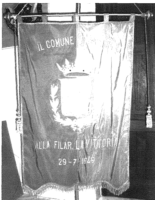
Fig. 11. L-istandard moghti mill-Comune Di Catania b'tifkira tal-mawra f'dik il-belt.

B'tifkira ta' din il-mawra l-Banda La Vittoria kienet giet irregalata standard ordnat apposta mill-Comune di Catania. (Fig. 11.)