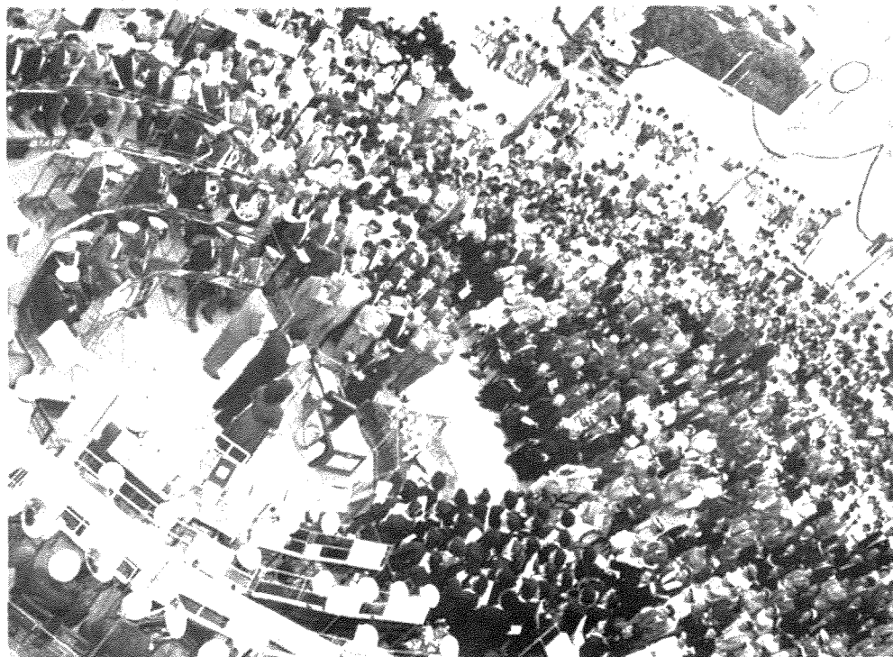
Fig. 16. Il-pjazza mballata bil-nies ghaċ-ċelebrazzjonijiet tal-anniversarju.

Kif jixhdu Fig. 16 u 17, minbarra l-bandisti, il-kor u l-mistednin. il-pjazza kienet imballata bin-nies li ntabbu kull fejn sabu naqra post.