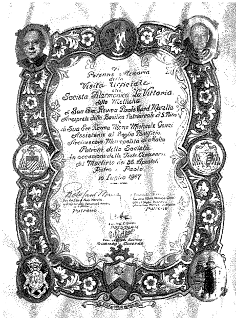
Fig. 23. Id-dokument iffirmat minn Marella u l-Arcisqof Gonzi fl-1967 ta' meta saru patruni tas-Socjetà La Vittoria.

T'ifkira oħra li nsibu fil-kazin huwa Fig. 24. F'dan ir-ritratt huwa rigal personali tal-Kardinal Marella lis-Socjetà. Taħt ir-ritratt hemm kitba minn idejn il-Kardinal Marella nnifsu u tgħid hekk.