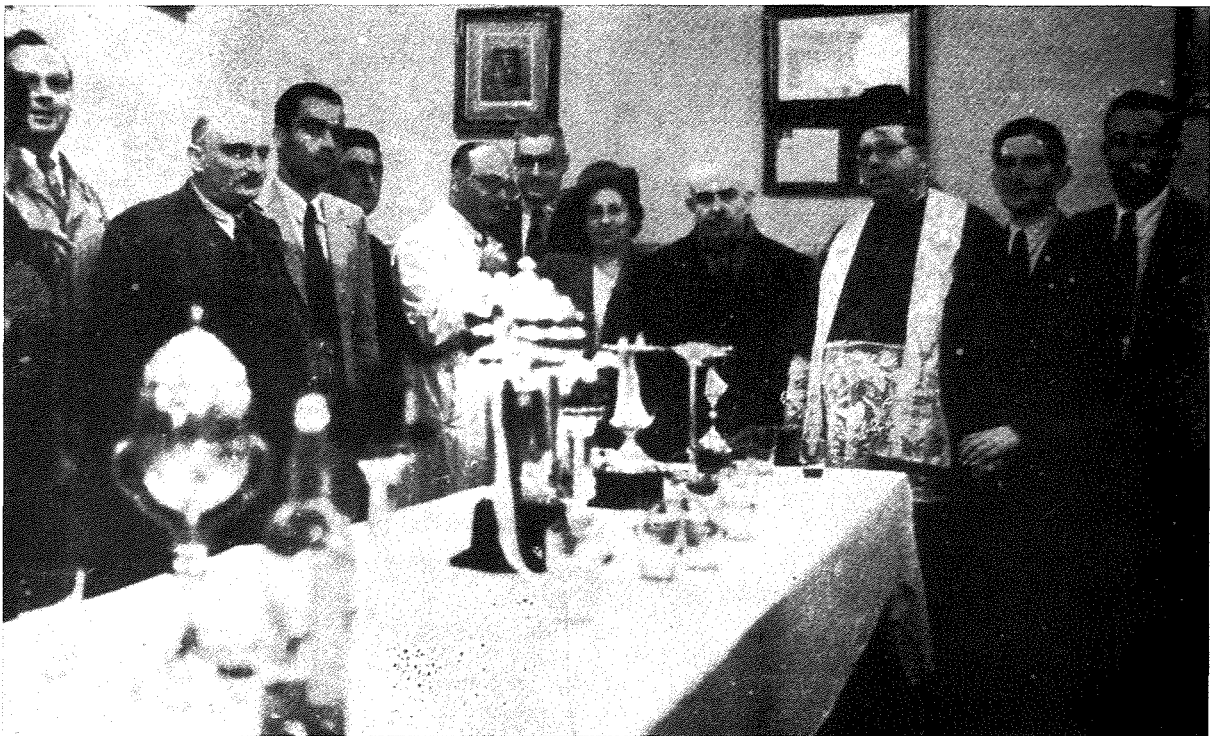
Fig. 25. L-unika żjara tal-PM Dr. Paul Boffa fil-każin La Vittoria fl-1947.