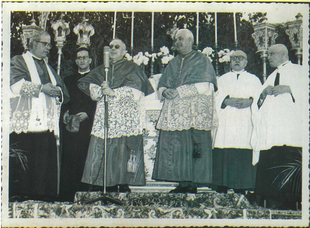
Fig. 21. L-Em. T. Il-Kardinal Mons. Paolo Marella jgħid kelmtejn tal-okkażżjoni lill-folla li ngabret fejn is-Santwarju għaċ-ċerimonja taċ-Ċentinarju Pawlin.

Iċ-ċerimonja nżammet fis-Santwarju fejn il-kardinal Marella anke ta l-barka apostolika tiegħu lill-ġemgha miġbura. Kien assistit ukoll mill-Kleru Mellieħi kollu (Fig. 21.)