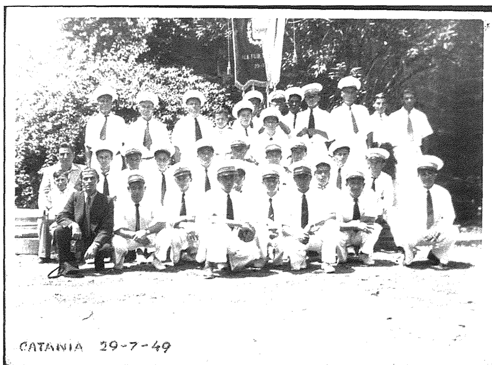
Fig. 12. Il-bandisti tal-La Vittoria ġewwa Villa Bellini jippużaw quddiem l-istandard ta' tifkira moghti lill-banda mill-Comune di Catania fl-1949.

Wiehed mill-isbah ritratti li fadlilna ta' din il-mawra (Fig. 12.) juri numru ta' bandisti Mellihin migburin quddiem l-istess standard ta' tifkira msemmi hawn fuq.