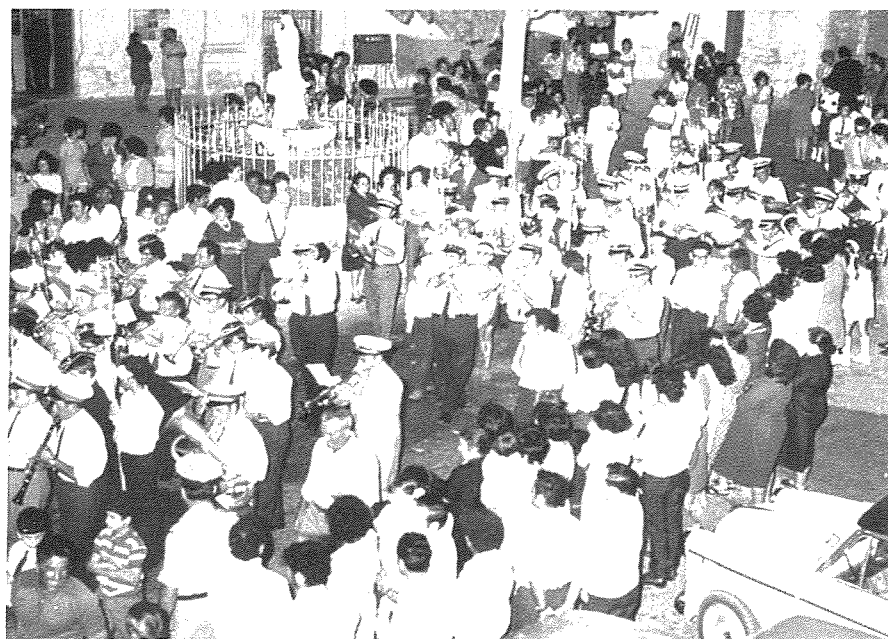
Fig. 28. Il-Bandisti heġġin mill-bitħa tas-Santwarju għal marċ ala Veneziana .

Ċelebrazzjoni bħal din ma setgħetx ma tingħalaqx bil-parteciċipazzjoni tal-banda nnifisha (Fig. 28.).