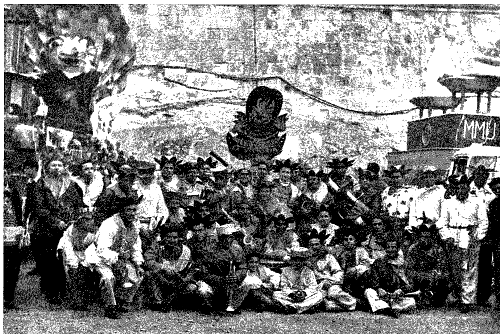
Fig. 10. Il-banda tipparteċipa fil-karnival fuq kummissjoni - "Les Gitans"

Il-karru kien qed jalludi għall-ġholi fil-prezz tal-ħobż u n-nuqqas fil-piż tal-ħobża Maltija meta mqabbel ma' flixkun ħalib. Dik il-ħabta l-poplu Malti kien iġerger ħafna għall-mod kif il-Gvern Kolonjali kien jitratta x-xiri tal-qmuġħ, taxxi fuqu u l-prezz relattivament għoli tal-ħobż.