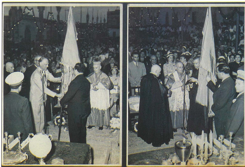
Fig. 13. Il-preżentazzjoni (xellug) u t-tberik tal-istandard (lemin)