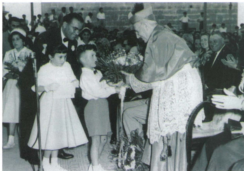
Fig. 15. Tfal jippreżentaw bukkett fjuri lil Mons. Arċisqof Gonzi.