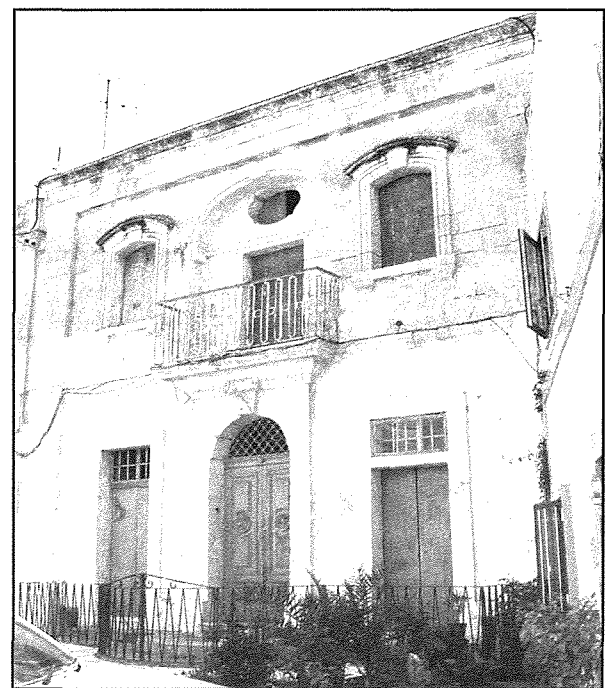
Dar id-Dar, 7 f' Misraħ Santa Marija, li fuq il-bieb prinċipali għandha minquxa xbiha tar-Redentur u l-annu 17.