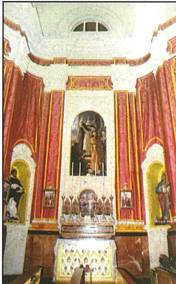
L-artal ta' San Vincenz