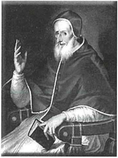
Il-Papa San Piju V

L-Ewropa Nisranija kienet mhedda mill-qawwa Torka. Minkejja l-Assedju ta' Malta u l-Assedju ta' Vjenna, it-Torok regġhu refġhu rashom. Il-qawwa tal-baħar Torka kienet tant qawwija li l-artijiet fiċ-ċentru tal-Mediterran kienu mhedda. Iż-żewġ qawwiet tal-Mediterran kellhom jiltaqgħu u l-qawwa tal-kanun tiddeċiedi minn kellu jaħkem f'din il-parti tal-Ewropa.