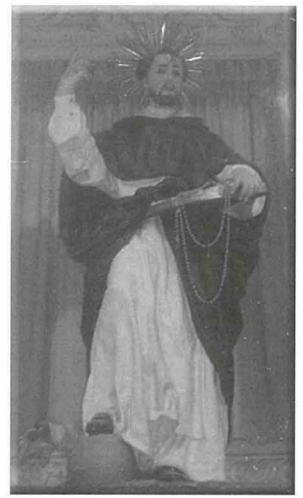
L-istatwa ta' San Duminku fir-Rabat

Fil-Birgu, fil-Belt Valletta u fir-Rabat il-purċissjoni tal-Madonna kienet tinkludi żewġ statwi, dik tal-Madonna tar-Rużarju u dik ta' San Duminku. Fil-belt Valletta din id-drawwa waqfet, tassew ħasra! Iżda fir-Rabat u fil-Birgu din id-drawwa ta' żewġ statwi fil-purċissjoni tal-Madonna tar-Rużarju baqgħet. Din hi l-unika purċissjoni barra dik tal-Ġimgħa l-Kbira li fiha tieħu sehem aktar minn statwa waħda.