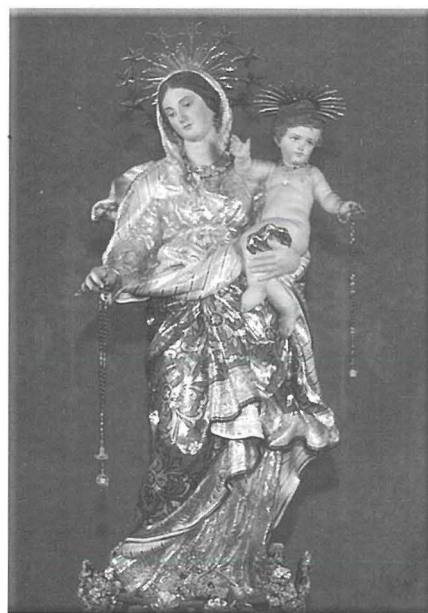
L-istatwa tal-Madonna tar-Rużarju fir-Rabat

Il-fratellanza tar-Rużarju tal-Belt Valletta daħlet statwa tal-injam tal-Madonna tar-Rużarju. Din saret min id Giuseppe Mazzero de Rizzini. Din id-drawwa kompliet meta l-fratellanza tar-Rużarju tar-Rabat fl-1661 daħlet statwa oħra tal-Madonna tar-Rużarju. Din saret minn Melchiorre Gafà. Din l-istatwa saret popolari fost il-poplu Malti l-aktar dawk id-devoti tal-Madonna tar-Rużarju. Din l-istatwa, maż-żmien saret l-istatwa mudell ta' ħafna statwi Marjani sew tar-Rużarju u sew tal-Madonna tal-Karmnu. L-istatwa tar-Rużarju ta' Ħal Tarxien tixbaħ lil dik tar-Rabat waqt li l-istatwa tal-Madonna tal-Karmnu taż-Żurrieq saret ukoll fuq l-istil ta' din l-istatwa.