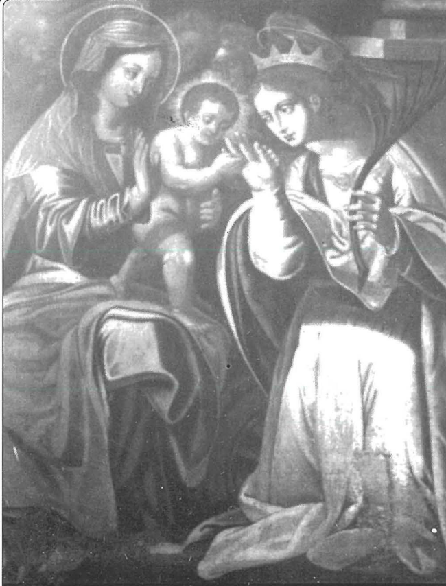
Il-Kwadru Titulari meqjum fil-Knisja ta' Santa Katarina f'Hal Qormi