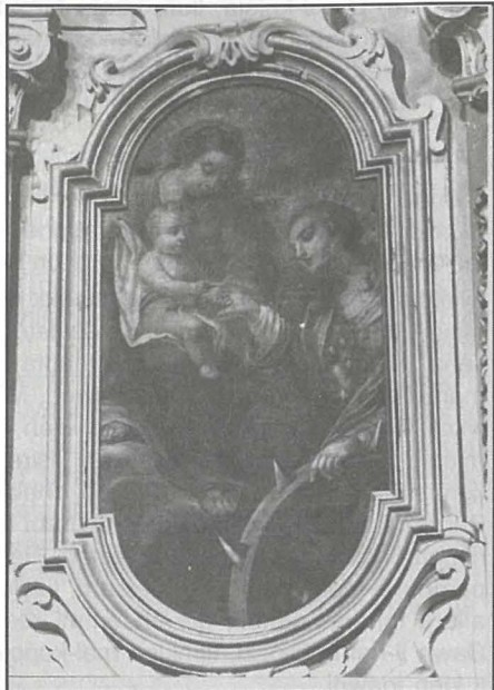
Ritratt tal-kwadru meqjum fil-Knisja parrokkjali tal-Gudja