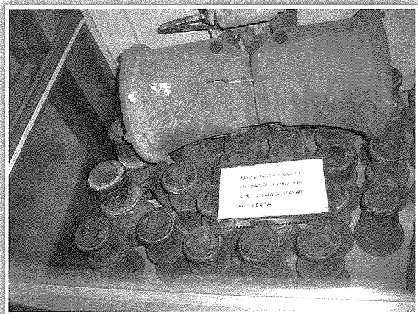
Eżemplari ta' maskli tal-bronż li kienu jintużaw fil-festa ta' San Ġorġ u li illum qegħdin fil-Mużew Parrokkjali.

Ghedna li l-miġja tal-pirotekniċi Taljani ttrasformat is-sistema tan-nar f'Malta u nġhidu għaliex. Dak iż-żmien, il-murtali tal-kulur bi ftuħ u qisien differenti flimkien mal-biċċiet mekkanizzati tan-nar tal-art kienu hwejjeg kompletament ġodda għall-gzejjer Maltin u, naturalment, kienu bosta dawk in-nies li bdew jiġu Hal Qormi biex igawdu dan l-ispettaklu. Hemm awtur li saħansitra kiteb li kien ikun hawn madwar 20,000 ruh fil-wied ta' Hal Qormi jsegwu n-nar tal-art. Hi haġa ovvja wkoll li lokalitajiet oħrajn imitaw lil Hal Qormi u nġaġġaw pirotekniċi barranin biex itejbu l-prodott tagħhom. Iżda jibqa' l-fatt li Hal Qormi kien l-ewwel post li sehħlu jagħmel din il-qabza importanti fil-kwalità tan-nar li beda joffri. Anzi, kif ser naraw aktar 'il quddiem, il-Belt Pinto reġgħet kienet fl-ewwel post li introduċiet affarijiet oħra.