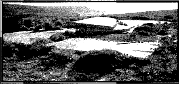
Il-postazzjoni tas-searchlight f'Tal-Bisqra.