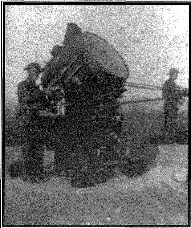
Ritratt ta' 90cm Searchlight ta' Kontra l-Ajruplani.