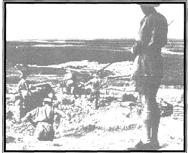
Kanun tat-tip Bofors 40mm Light anti-aircraft gun u l-ekwipaġġ tiegħu viċin Forti Campbell.

Mapep kontemporanji ta' Malta juru l-pożizzjonijiet