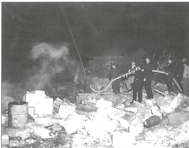
Is-snin 1956 u 1958 kienu snin li fihom l-għaqda rat żewġ incidenti fatali

Xi ħaġa li komplet tispikka f'dan kollu kienu l-kuluri mill-isbaħ li din l-għaqda kienet tħallat, kuluri ta' kwalità. Sa mill-bidu ta' din