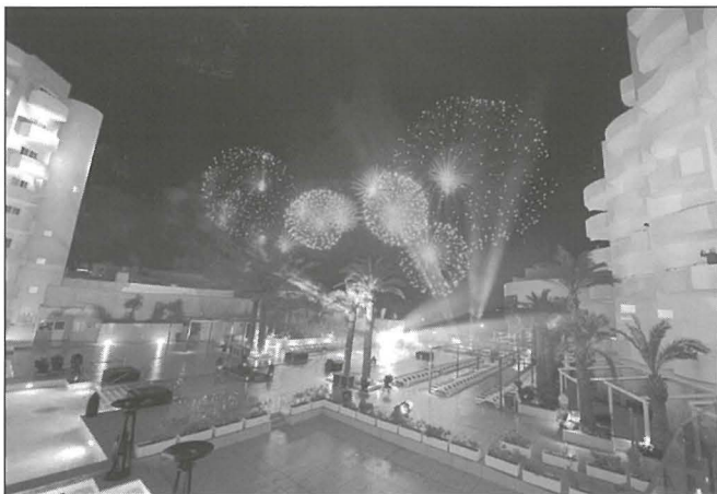
L-għaqda hadet ukoll sehem fil-ftuħ ta' postijiet importanti għall-ekonomija Maltija

Għalhekk din il-kamra tan-nar li twaqfet disġin sena ilu mistennija tkompli taħdem biex bħalma sar minn dawk li ġew qabilna l-membri ta' din l-għaqda ikomplu jiktbu l-istorja b'ittri tad-deheb.