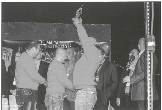
Għall-ewwel darba li ħadet sehem l-għaqda kienet kisbet it-tieni post u rebħet l-premjura tat-televoting