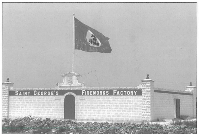
Il-post lest minn kollox ftit jiem qabel ma nfetaħ fis-sena 1982