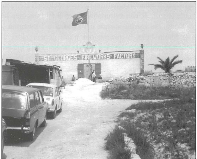
Il-kamra tan-nar ffit jiem qabel id-diżgrazzja tas-17 ta' Mejju