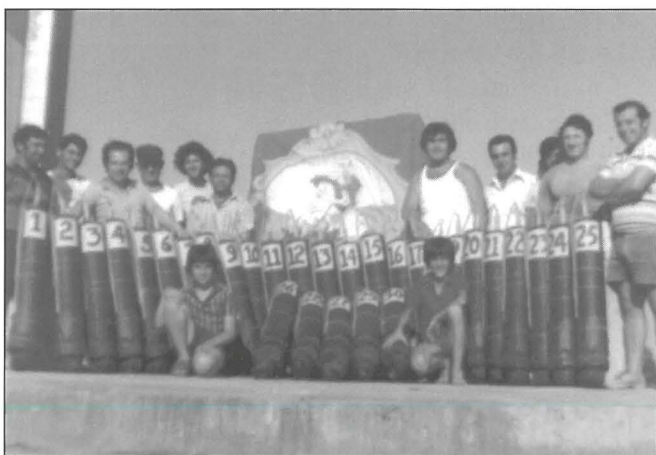
Lejn tmiem is-snin 70 u l-bidu tas-snin 80, l-għaqda kienet f'mument mill-isbaħ