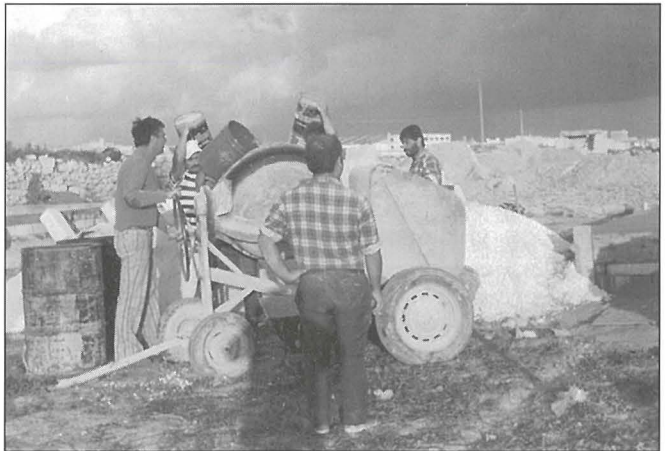
Kienu diversi l-voluntiera mhux biss ħaddiema tan-nar