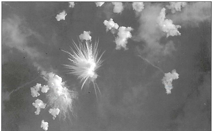
It-terminu Kaxxa Spanjola oriġina minn din il-kamra tan-nar

Insibu li fis-snin ta' wara l-Gwerra l-għaqda kienet involuta wkoll f'festeġjamenti kbar. Fost oħrajn meta ġiet inkurunata r-Reġina Elizabetta it-tieni, u anke f'festi speċjali tal-Festa tal-patrun tagħha.