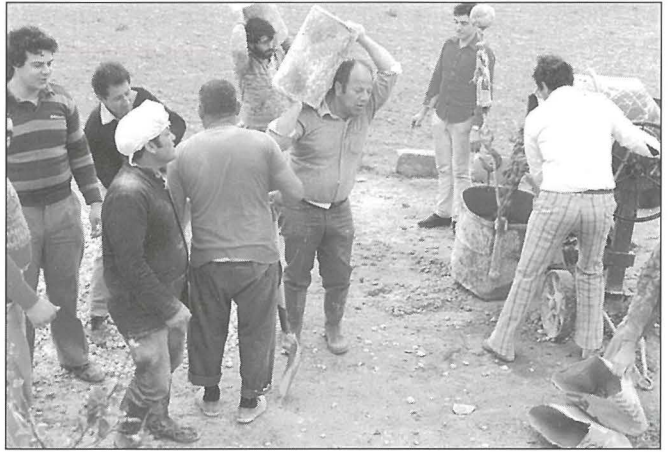
Il-permess ta' bini ta' kamra tan-nar ġdid kien nissel entużjażmu kbir

Wara xhur ta' ħidma, f'Mejju tal-1986 sa fl-aħħar wasal jum l-inawgurazzjoni, il-Ġorġjanizi reġa' kellhom il-post tan-nar tagħhom. Dik li kienet ħolma issa saret realtà.