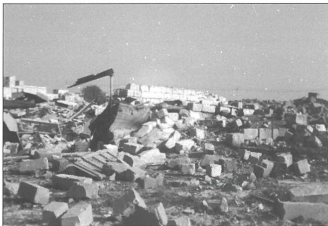
L-isplużjoni tas-17 ta' Mejju tal-1982, halliet herba shiħa

Dakinhar ukoll għall-ewwel darba lejn il-Kamra tan-Nar tela' żagħżuġ li qatt ma kien