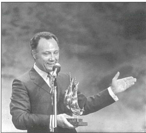
Claudio Villa twieled fl-1926

Nhar l-Erbgħa, 21 ta' April ta' dik is-sena twieldet Elizabeth Alexandra Mary Windsor li fl-1953 saret ir-Reġina Eliżabetta II li sat-13 ta' Diċembru 1974 kienet ukoll ir-reġina ta' Malta. Fil-25 ta' April itellgħet għall-ewwel darba l-opra lirika ta' Giacomo Puccini Turandot ġewwa t-teatru La Scala ta' Milan. Fil-31 ta' Ottubru, Benito Mussolini kien qiegħed iżur Bologna u hemmhekk xi hadd sparalu. Wehel Anteo Zamboni, żagħżuġ ta' 15-il sena, li ġie maqtl fuq il-post. Fid-19 ta' Novembru twaqqaf il-Commonwealth.