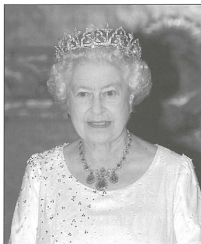
Ir-Reġina Elizabetta t-tieni twieldet fl-1926

Bħala popolazzjoni, fl-1926, Ħal Qormi kien hemm joqogħdu 4,665 raġel u 4, 621 mara. Meta niftakru li r-raħal tagħna kien għadu parroċċa waħda, nindunaw li kien popolat mhux