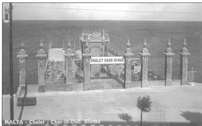
Anke x-Chalet f'Tas-Sliema fetiħ 1926