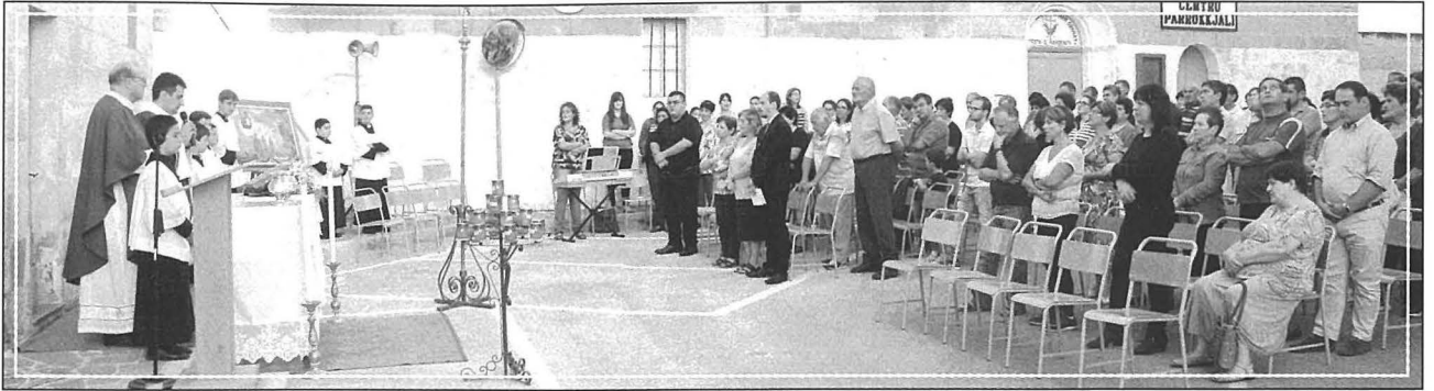
It-Tifkira li saret fl-10 ta' Ottubru 2017