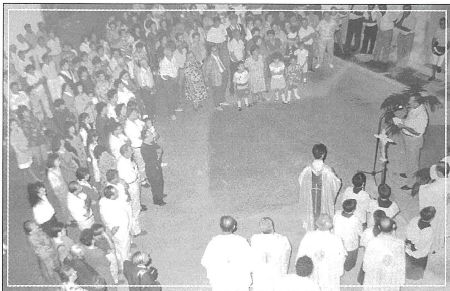
It-Tifkira li saret fl-10 ta' Ottubru 1992

għamel diskors tal-okkażjoni, bħala persuna li mhux biss għix fi tfulitu ż-żmien tal-gwerra, imma l-familja tiegħu kienet saħansitra tgħix fil-vicinanzi tat-traġedja.