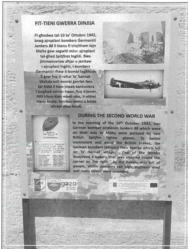
Panella dwar il-Gwerra fil-Pjazzetta Tax-Xelina

fosthom ukoll hafna barranin, jistghu jkunu jafu ahjar l-istorja ta' din it-tragedja.