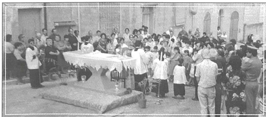
It-Tifkira li sar fl-10 ta' Ottubru 1987