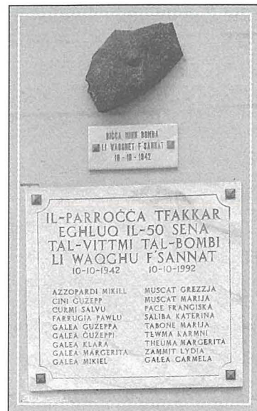
Il-Monument tal-Gwerra fi Triq Dun Xand Aquilina

Wara s-sena 1992 din il-ġrajja tal-gwerra baqgħet hafna drabi tiġi mfakkra fil-Bullettin tal-parroċċa. Minbarra snin li huma diġa msemmija qabel, inżid wkoll dawn li ġejjin, dejjem fix-xahar ta' Ottubru, imfakkra f'dik il-ġimgħa preċedenti tal-anniversarju: fl-1995 (no 1388), fis-snin 1999 (no 1597) u 2000 (no 1649), bejn is-snin 2004 u 2007 (no 1856, no 1910, no 1962 u no 2271) u bejn is-snin 2009 u 2012 (no 2114, no 2166 u no 2167 - fl-2010 f'zewġ iħdud konsekuttivi), no 2219 u no 2271).