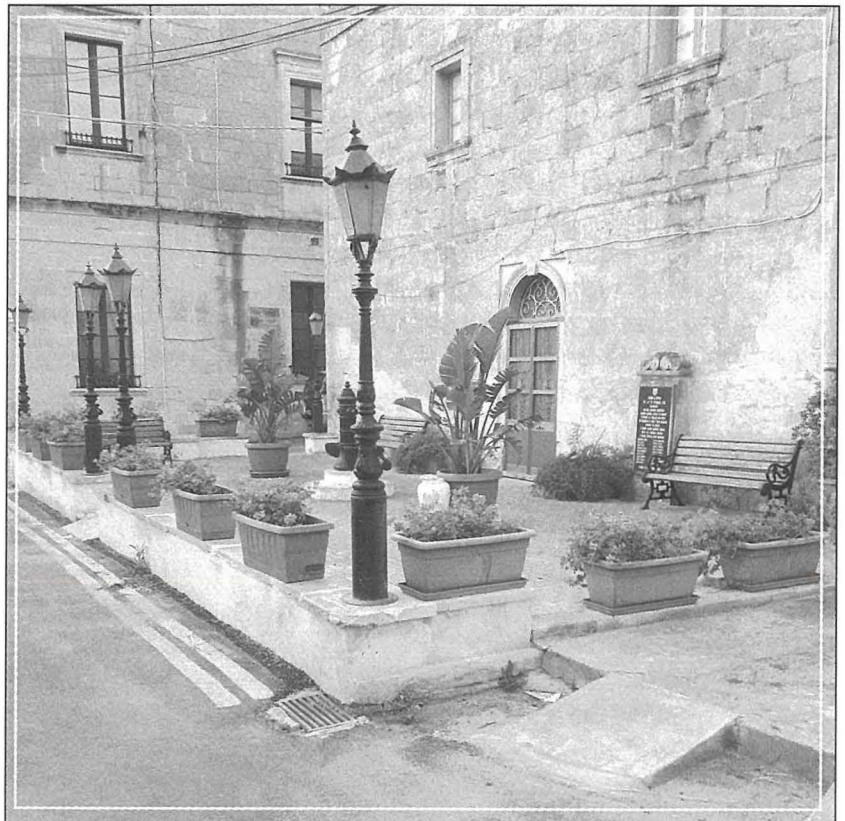
Il-Monument tal-Gwerra fil-Ġnien 'Vittmi tal-10 ta' Ottubru 1942' fi Triq il-Kbira