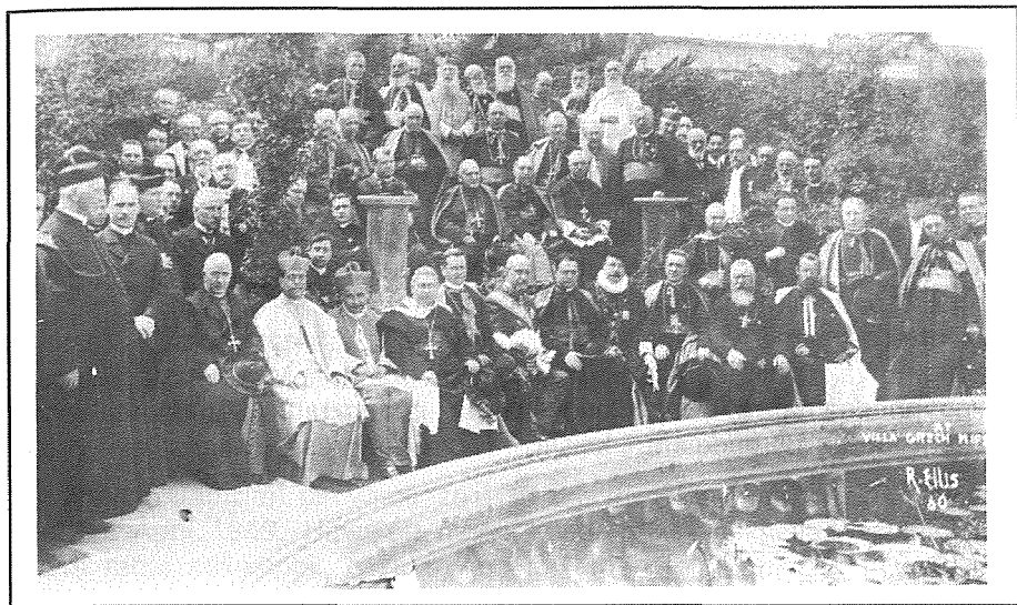
Il-Kardinali, l-Isqfijiet, il-Kongressisti u l-Kumitat Malti li ħadu sehem fl-XXIV Kungress Ewkaristiku Internazzjonali miġbura fil-Villa ta' Dr. Oreste Grech Miġsud.