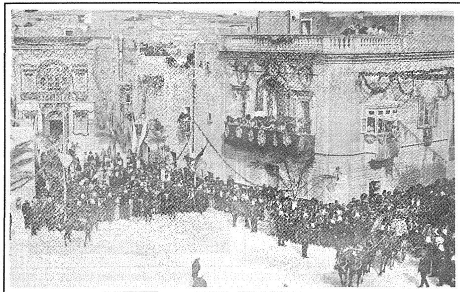
L-inħawi tal-pjazza tal-Mosta mżejnin għall-okkażjoni, waqt il-wasla tal-kungressisti.

Jekk Malta ferħet li ntemmet din il-polemika, ferħu aktar il-Mostin li l-knisja tagħhom kien se jkollha dan l-unur. Mill-ewwel bdew it-tnejjiet u twaqqaf kumitat apposta u meta qorob iż-żmien il-knisja, il-pjazza u t-triq prinċipali ġew armati bħal nhar il-festa titolari. Il-galleriji u t-twieqi ġew ukoll imżejna għal din l-okkażjoni. Il-Mostin taw kontribut kbir biex fir-raħal tagħhom tinholq atmosfera mill-isbaħ. Kull min żar il-Mosta f'dawk il-ġranet żgur li baqa' impressjonat bil-mod kif ġiet imżejna.