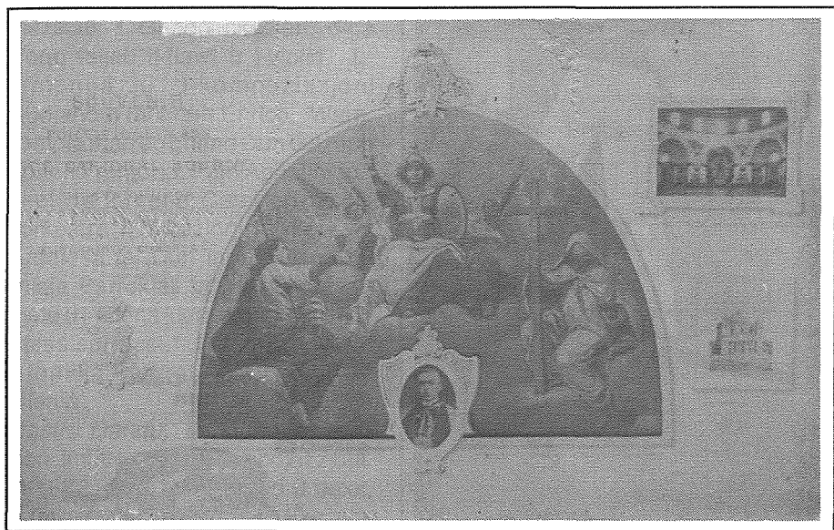
Tifkira tal-Pontifikal mill-Eċċ. Rev. il-Kardinal Francesco Bourne, Arċisqof ta' Westminster, fil-knisja tal-Mosta nhar is-26 t'April, 1913.