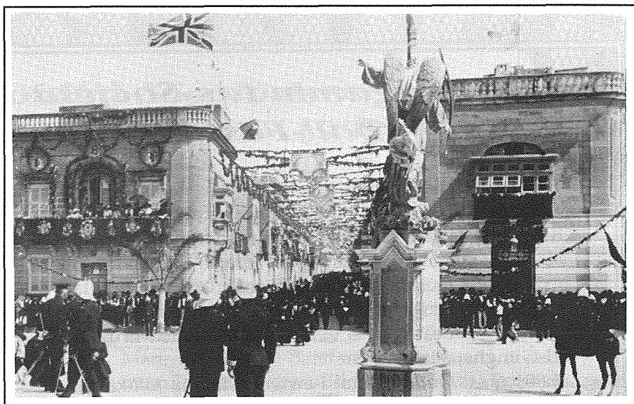
It-tiżġin fi Triq il-Kungress Ewkaristiku kien jikkonsisti prinċipalment f'kartelluni bi stemmi ta' l-Ewkaristija mpittra fuqhom.

Nhar l-Erbgħa, 23 ta' April, 1913, wara nofsinhar it-toroq kollha li jwasslu għall-Mosta kienu mimlija haġja. Numru kbir ta' karrozzini, u motorcars kienu qegħdin iwasslu lill-isqfijiet, kongressisti u nies oħra għaċ-ċerimonja tal-ftuħ tal-Kungress. L-inħawi ta' madwar il-knisja tal-Mosta kienu imballati bil-Maltin, li ngabru f'dak il-misraħ biex jaraw dik ix-xena.