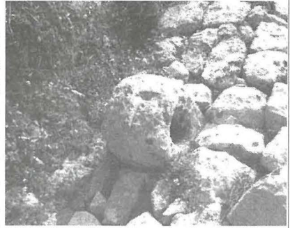
Il-ħolqa tal-gebel fil-ħajt għall-habel tat-tigrija tal-bghula. Kienet fi Triq Marziena.

Kull tigrija kienet titlaq minn wara habel b'tarf wiehed marbut f'ħolqa tal-gebel fil-ħajt fil-ġenb tat-triq u bit-tarf l-ieħor miżmum minn persuna li kienet titilqu hekk kif surgent tal-pulizija kien jispara tir b'pistola bħala sinjal għat-tluq tat-tigrija. Minħabba tulijiet differenti tat-tigrijiet, għar-raġunijiet li semmejna iktar '1 fuq, fil-ġenb tat-triq tat-tigrija (illum, Triq Marziena) kien hemm, mill-inqas, tlitt ħoloq tal-gebel fil-ħajt bħal dik li għadna kif semmejna: waħda lejn tarf il-Munxar għat-tigrija tad-dwieb u ż-żwiemel, oħra iktar viċin lejn Ta' Sannat għat-tigrija tal-ħmir, w oħra daqs nofs id-distanza bejn dawn it-tnejn għat-tigrija tal-bghula. Minn dawn it-tlitt ħoloq tal-gebel fil-ħajt, waħda biss kien għad fadal: dik tat-tigrija tal-bghula iżda, sfortunatament, inqas minn sena ilu, din sfat nieqsa wkoll biex b'hekk m'għad fadal l-ebda waħda minnhom.