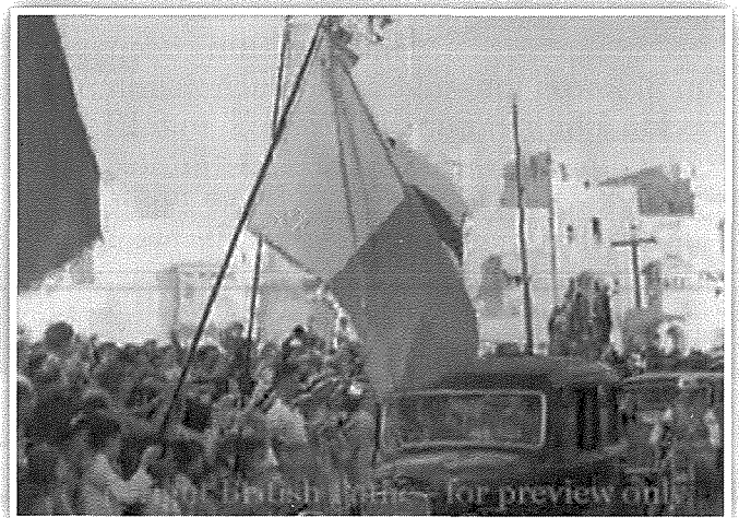
Ir-Re Ġorġ fil-pjazza taż-Żejtun. Jidher is-salib tal-Pjazza fuq wara tal-karozza tar-Re

Mir-Rabat ir-Re niżel lejn Haż-Żebbuġ, Ħal Qormi u Ħal Luqa. F'Ħal Luqa mar jiltaqa' mal-Kmandant tal-Ajru u n-nies tal-R.A.F. (Royal Air Force) kif ukoll mar jara l-ajruplani u x-xogħol li kien qed isir ġewwa l-ajruport. Hawnhekk ir-Re qassam xi onoreficienzi għall-qlubija lil bosta personalitajiet tal-R.A.F. Minn Ħal Luqa r-Re għadda biex iżur l-ajruport ta' Ħal Far u wara baqa' sejjer lejn Kalafrana, Birzebbuġa u meta wasal Bir id-Deheb daħal ġewwa r-raħal taż-Żejtun.