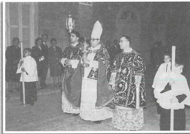
Dun Mikiel Spiteri

preżenti tal-Mellieħa kien baqgħalha hafna snin biex tinbena. Ir-rettur kien jagħmel xogħol ta' kappillan. Miet fis-sena 1782. Dun Ġużepp Saliba , attiv fiż-Żejtun fis-snin 50 tas-seklu 18, sar kappillan tal-Gudja fis-sena 1767, fejn dam sas-sena 1780. Dun Tumas Scicluna , attiv fiż-Żejtun fis-snin 80 tas-seklu 18, sar kappillan fl-1801, ta' Haż Żebbuġ , fejn dam sas-sena 1830. Dun Franġisk Grech , iben Ġużeppi u martu Tomasina, twieled fiż-Żejtun fis-sena 1737. Fis-sena 1758 ha l-lawrja fit-Teoloġija mill-Kulleġġ tad-Dumnikani fil-Belt Valletta. Kien konfessur tas-sorijiet ta' Santa Skolastika fil-Birgu. Sar kappillan ta' Hal Lija fis-sena 1772 u dam hemm sas-sena 1793, meta ġie maħtur monsinjur. Fi żmienu saret il-konsagrazzjoni tal-knisja ta' Hal Lija. Miet fil-Belt Valletta fis-sena 1796. Dun Bert Ellul , iben Ġormu u Gratia, twieled fiż-Żejtun fis-sena 1759. Sar kappillan tal-Għargħur fis-sena 1791, fejn dam sa mewtu fis-sena 1808. Nistgħu ngħidu li serva ta' kappillan "taħt tliet saltniet" – Kavallieri, Franċiżi u Inġliżi! Ra r-rewwixta tal-Maltin kontra l-ħakkiema