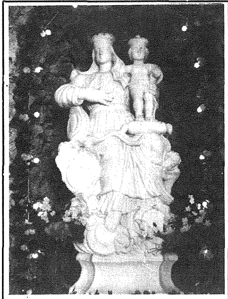
L-Istatwa tal-Madonna ta' l-Ispersanza li tinsab fl-Għar li għandu devozzjoni Marjana antika.

Ġrajjet din il-knisja jibdeu mill-għar li jinsab taħt din il-knisja, li fuqu tidher in-niċċa ta' San Mikiel Arkanġlu. Dan il-għar wiehed jinżel għalih minn fuq iz-zuntier ta' din il-knisja. Fil-għar, imzejjen bil-qsari, naraw statwa ta' tfajla għarkubtejha biex tfakkarna fit-tfajla li magħha hi marbuta storja li tgħid li tfajla, waqt l-attakk tat-Torok