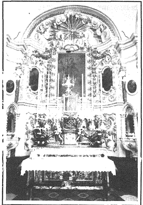
Il-prospettiva u l-altar ewlieni tal-Knisja ta' l-Isperanza fil-Mosta.

Din il-knisja kienet minn dejjem iċ-ċentru tat-tama ta' bosta pellegrini, li,