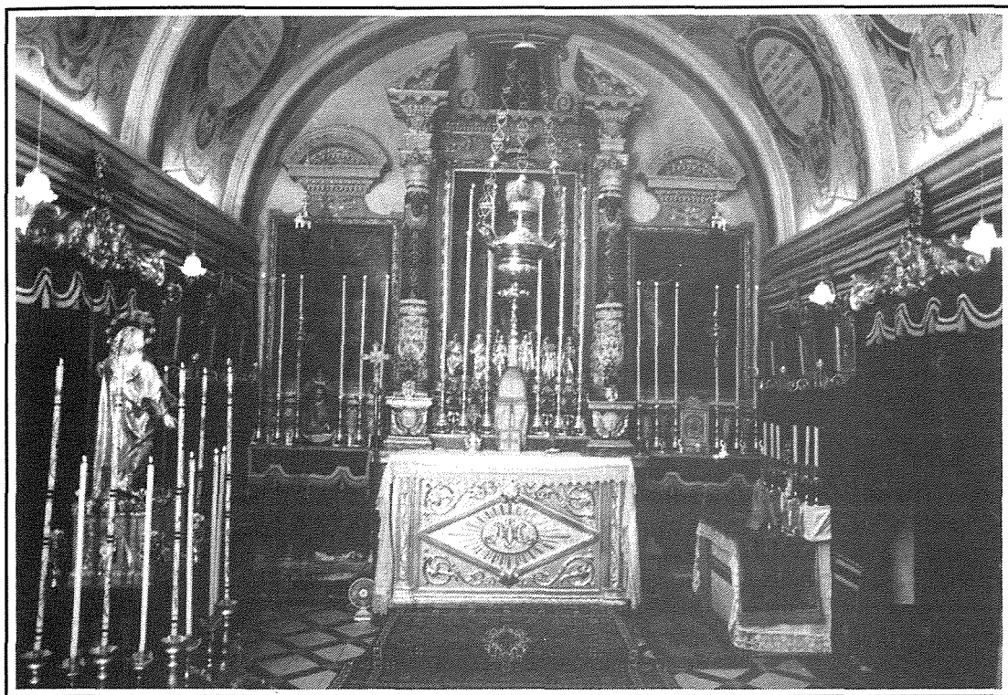
Dehra tal-knisja "Ta' Wejda", armata għall-festa.

ta' bosta quddies. Dan il-legat hu rreġistrat fl-Atti tan-Nutar Ġwanni Pawlu Fenech tas-7 ta' Mejju, 1644.