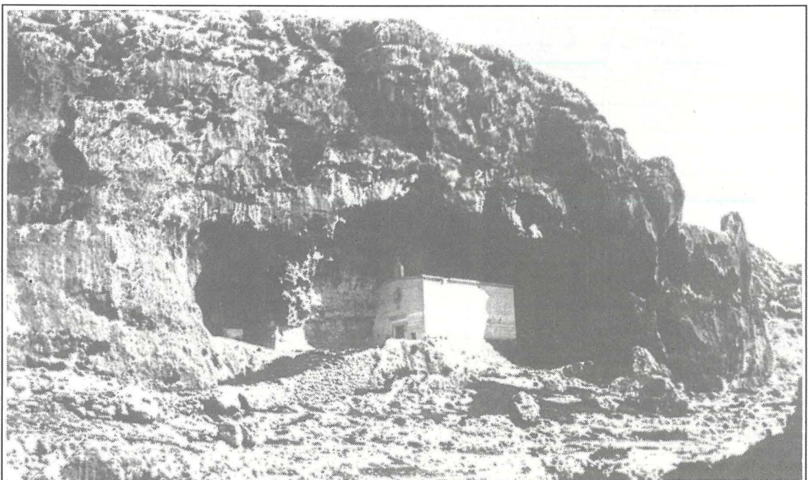
Il-Kappella ta' San Pawl l-Ewwel Eremita kif tidher bil-mod pittoresk tagħha fil-għar qalb il-blat ta' Wied il-Għasel - faċċata taż-żona ta' Santa Margerita.

Din ix-xorta ta' ħajja - ta' eremita fl-eremitaġġi - fi Sqallija kienet, sa minn żminijiet imbiegħda, komuni ħafna, 1 imma bla ma nitkellmu, almenu għalissa, fuq id-diversita` ta' dan il-fenomeni, ngħidu li fi hdn it-Tielet Ordni Frangiskan, insibu bosta minn dawn l-eremiti, li xi whud minnhom waslu sa l-oghla quċċata tal-qdusija u l-Knisja tagħrafhom bħala