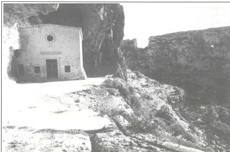
Dehra oħra tal-Kappella ta' San Pawl l-Ewwel Eremita ftit qabel ma' ġiet restawrata fl-1992.

Il-kelma Dejr li G. Wettinger jittraduċiha bl-Ingliż monastery-like building 24 u E. Serracino-Ingloft, fosthom Dar kbira ta' xi kap; palazz; dar fejn joqogħdu n-nies ta' xi familja kbira; ospizju ,