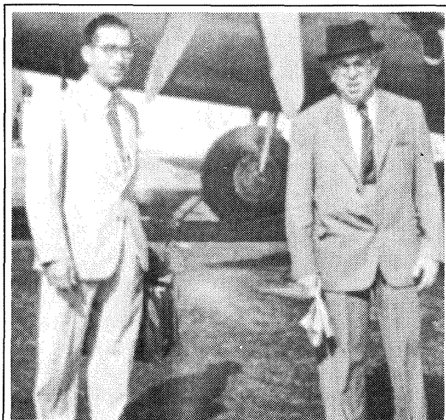
Sir Paul Boffa, Mexxej tal-Partit Laburista, flimkien mal-Perit Duminku Mintoff, fil-bidu tal-karriera politika tiegħu.

Wara l-membri tal-familja, imxew l-E.T. l-Gvernatur, l-E.T. Mons. Arcisqof, u l-Onor. Dr. Ġ. Borg Olivier. Imbagħad purċissjoni ma tispicċa qatt sal-Bieb tal-Bombi ta' kapijiet,