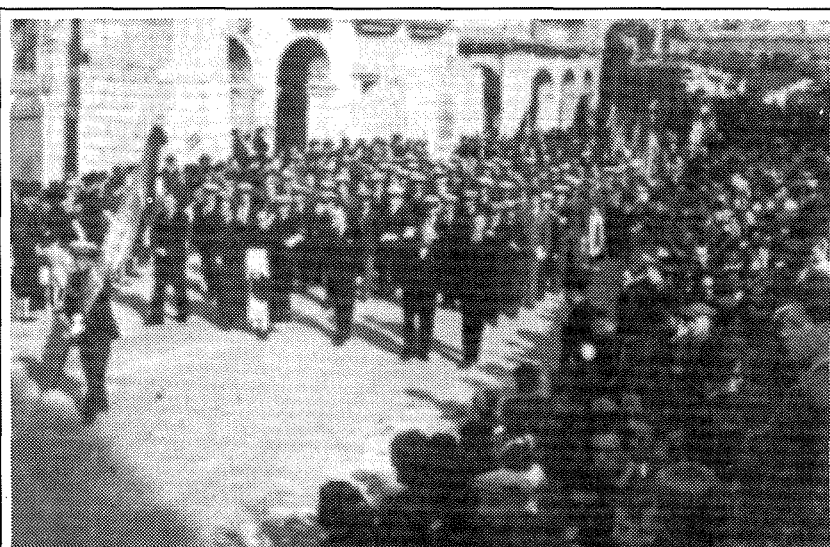
Rappreżentanti mill-Każini tal-Banda fil-funeral statali tal-Prim Ministru Nerik Mizzi.