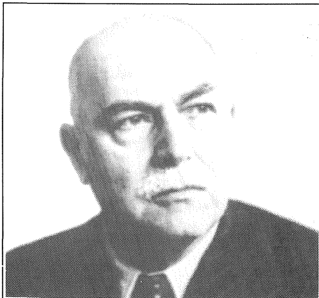
Dr. Enrico Mizzi - (1885 - 1950)

DOTTOR ENRICO MIZZI, jew kif kien popolarment magħruf, NERIK MIZZI, kien ċertament wieħed minn dawn il-figuri prominenti li għex u hadem kemm felaħ f'uħud mill-mumentu l-iktar diffiċli ta' l-istorja ta' pajjiżna. Fil-ħajja politika tiegħu, żgur li kellu avversarji daqs-kemm kellu hafna ħbieb, għal hafna oħrajn kien ukoll meqjus bħala bniedem kontroversjali, iżda wara li wieħed jiżen iċ-ċirkostanzi kollha li fihom huwa għex u janalizza haġtu fil-konfront ta' oħrajn kontemporanji tiegħu, isib li l-onesta` u l-irġulija tiegħu magħgħuna mal-konsistenza ta' ħsibijietu u l-maturita` politika tiegħu, sawwru fih personalita` mill-aktar prominenti fil-ġrajja tat-taqtiġha bla waqfien tal-poplu Malti biex