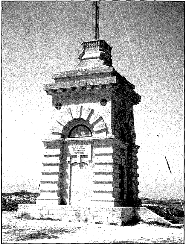
Il-pedestall tal-ġebel tas-Salib ta' l-Għolja maħdum mill-Imghallem Pietru Mallia.