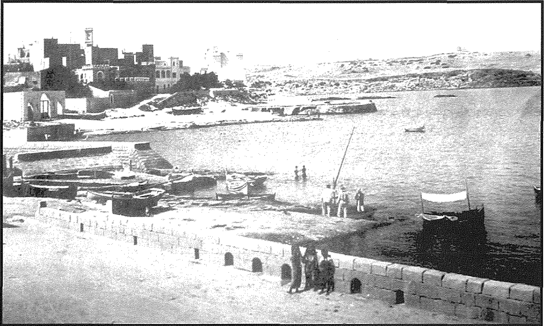
Veduta ta' San Pawl il-Baħar fil-bidu tas-Seklu Għoxrin