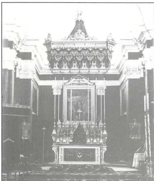
Il-Knisja armata għall-festa lejn tmien is-seklu 19 jew fil-bidu tas- seklu 20. Jidhru l-vintartal, il- kanopew tat-tabernaklu u t-tużell li saru fl-1895.