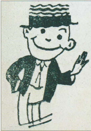
Il-‘habib’ tar-riwiista u l-abbonati tagħha