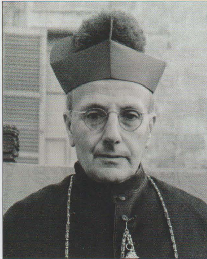
Mons. Mikiel Gonzi K.B.E., D.D. (1885-1984) – Arċisqof ta' Malta.

timxi 'l quddiem. Hajar ukoll lill-AK li dejjem habirket biex tqassam MM u ssib abbonati godda, u lill-Krocjata Missjunarja San Pawl tas-Seminarju li dejjem bagħtet artikoli u suggerimenti ta' fejda mhux žghira. Hija x-xewqa tal-editur, li dan il-Ġublew tal-Fidda tal-perjodiku jigi ċelebrat 'b'dik is-simpliċità karatteristika tal-missjunarji li biha dejjem mexa tul dawn il-25 sena.' Skontu, iċ-ċelebrazzjoni kienet marbuta wkoll mal-Ġurnata Missjunarja li tfakkar fil-miljuni ta' infidili mad-dinja kollha, b'mod speċjali fl-Afrika, fejn f'dik is-sena, Papa Piju XII (1876-1956) kiteb l-Enċiklika Fidei Donum (Id-don tal-fidi) 'biex jitlobna ninxteħtu b'hilitna kollha għall-konverżjoni ta' dan il-kontinent.' Huwa jagħlaq billi jhegġeg 'lill-qarrejja u hbieb kollha jitolbu, halli l-Mulej ikompli jixħet il-barka tiegħu fuq l-organu tal-OMP u jkompli jkattar l-għadd tal-abbonati.'