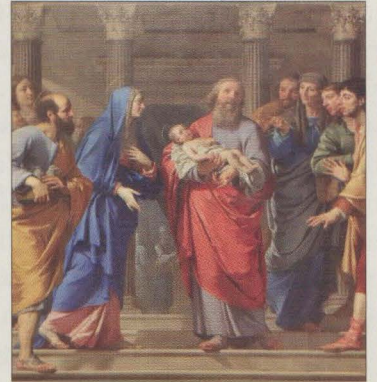
Frar - ix-xahar li jfakkarna fil-festa ta' meta l-Madonna pprezentat lil Ġesù fit-Tempju.

Frar 1961: Titlu: L-Ordinazzjoni; Bango: Jien illum drajt naqra sewwa / Naqra l-Malta Missjunarja; / Xi rakkont naqra lil ommi / Jew xi pagna sbejha varja!; Din Hi l-Opra Tagħkom: F'dan ix-xahar ftakarna fil-festa ta' meta l-Madonna pprezentat lil binha Ġesù fit-Tempju. Ġibu quddiem għajnejkom il-ferħ ta' hafna sorijiet missjunarji meta jieħdu fit-tempju xi tarbija, minn dawk li jkunu sabu barra, biex jgħammduha! Qatt ġemmajtu xi 2s.6d. biex tagħtu RISKATT TA' TARBIIJA? (Sena XXIX, Frar 1961, nru 2, p.46)