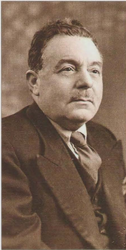
Is-Sur Nin Cremona

I l-kelmtejn ta' V.D.Ciappara fuq ix-xogħlijiet tal-konkors letterarju missjunarju deheru f' Malta Missjunarja Sena IX, Ġun.-Lul. 1941, nri. 6-7, pp.97-101 u kienu maqsumin kif ġej: