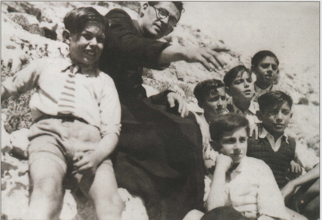
Dun Anton Xiberras f'waħda mill-ħarġiet mal-imseħbin tax-Xirka tal-Malti għat-Tfal (Fergħa Naxxar).

Ix-Xirka tal-Malti għat-Tfal fin-Naxxar: F'din is-sena