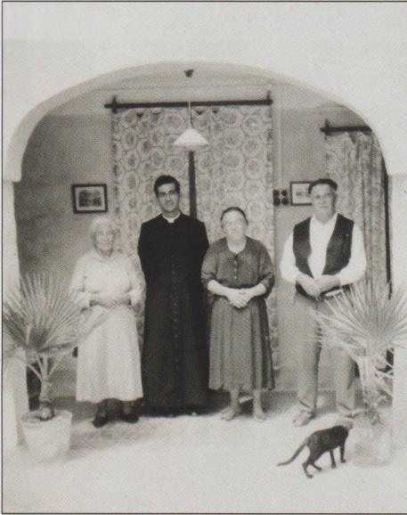
Dun Anton jippoġa għal ritratt tal-okkaġjoni flimkien ma' niesu ... u l-qattus (c. 1947)