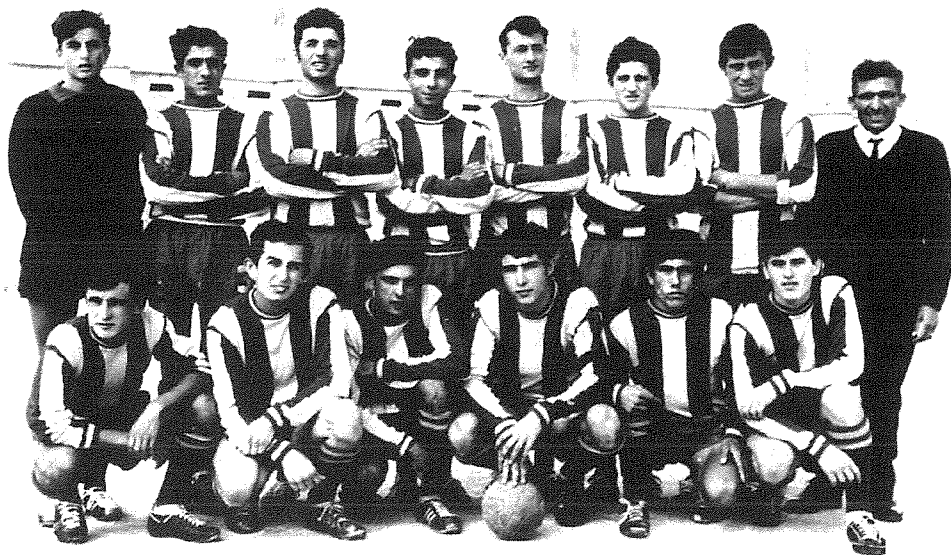
L-ewwel tim ta' San Lawrenz, 1968.

sodisfazzjon. Fl-istaġun 1994-1995, it-tim ta' taht it-tlextax-il sena kienu runners up , l-istess bhalma kien it-tim ta' taht l-erbatax-il sena fl-istaġun 1997-1998. L-aħħar riżultat tajjeb imniżżel fl-istorja tal-Klabb tagħna huwa dak għat-tim ta' taht it-tmintax-il sena, li kkwalifikaw bħala finalisti għal dan l-istaġun 2012-2013. Tajjeb li nsemmu li dan it-tim qed jilgħab taht l-isem Għarb-St Laurence , peress li f'dawn l-aħħar snin, minhabba n-nuqqas ta' tfal fiż-żewġt irhula qrib xulxin, reġghet ittiehdet id-deċiżjoni li jingħaqdu l-isforzi u titwaqqaf nursery wahda.