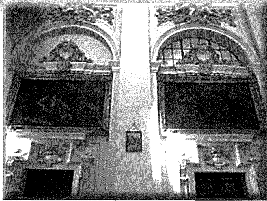
Dettall mill-ħajt tal-knisja