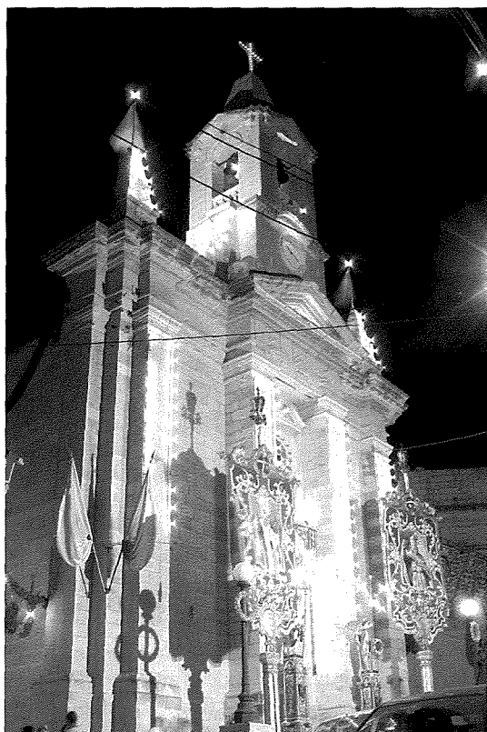
Il-Knisja Parrokkjali l-Antika ta' San Ġiljan Ospitalier, li minnha eventwalment għazilna isem raħalna, San Ġiljan

Dan tal-aħħar sar l-iktar isem konsistenti bis-saħħa tal-knisja li kif għidtilkom, iktar ma saret importanti u madwarha ssawwar ir-raħal, iktar saħħet l-isem tar-raħal. Wara li din il-knisja saret Viċi-Parroċċa fl-1848, din iktar kompliet tagħti identità lil dan ir-raħal. Meta fl-1891 din il-knisja saret parroċċa indipendenti bit-territorju tagħha u nqatgħet kompletament mill-Matriċi Elenjana ta' Birkirkara, din issiġġilat l-isem tar-raħal u minn dakinhar, dan il-post beda jissejjaħ San Ġiljan.