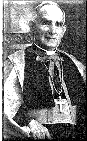
Dun Karm Psaila