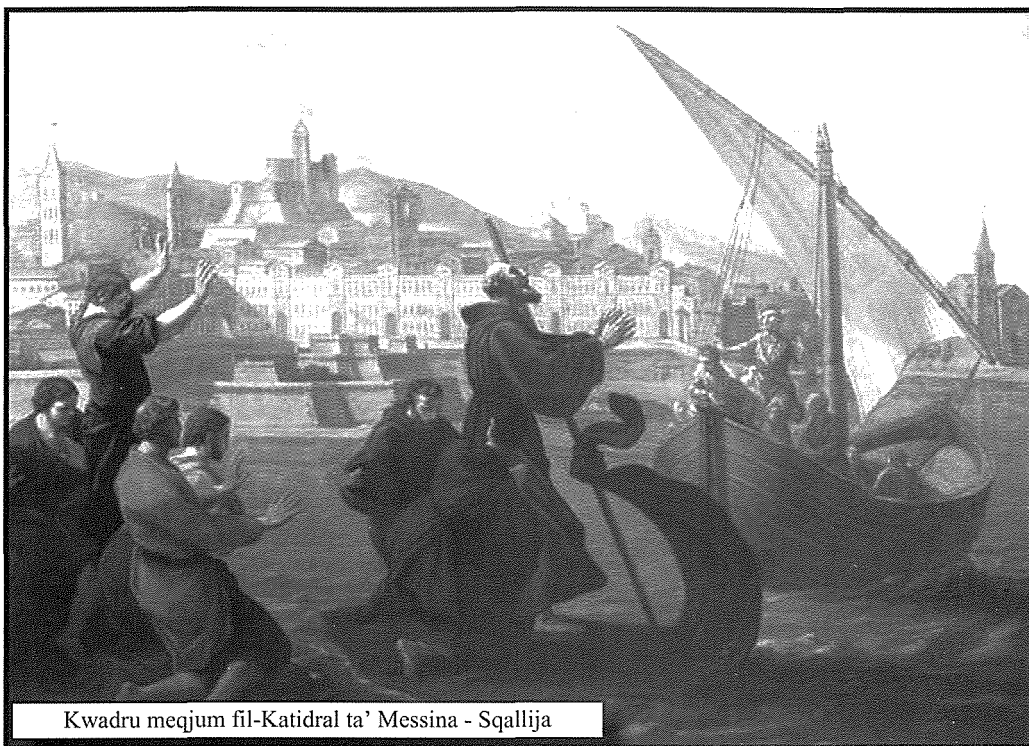
Kwadru meqjum fil-Katidral ta' Messina - Sqallija

L-iktar storja popolari marbuta ma' dal-qaddis hi dik meta qasam l-Istrett ta' Messina fuq il-mant tiegħu. Ġrajja li seħhet fl-4 t'April tal-1464.