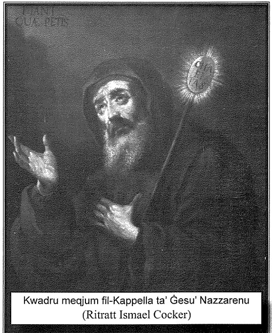
Kwadru meqjum fil-Kappella ta' Ġesu' Nazzarenu

Fil-31 t'Awwissu 1452, l-Arcisqof ta' Cosenza ta permess għall-bini ta' kappella fuq din l-art, wara li hu ra l-hajja qaddisa li kien qed jgħix Franġisku. Xi snin wara, Papa Pawlu II sema' bi Franġisku u l-komunità tiegħu u bagħat lill-Viżitatur Appostoliku tiegħu. Wara li mar lura Ruma, il-Viżitatur ta lill-Papa rendikont tal-hajja tajba ta' dawn l-eremiti. Fis-17 ta' Marzu tal-1470, Papa Sistu IV ta l-permess uffiċjali biex titwaqqaf l-Ordni tal-Patrijiet Minimi. Franġisku beda jwaqqaf kunventi oħra fin-Nofsinhar tal-Italja u jivvjaġġa minn belt għal oħra jgħallem l-Evangeli, iħabbar profeziji u jagħmel il-mirakli. Saħansitra l-fama tiegħu saret magħrufa mar-rejjiet tal-Ewropa ta' dawk iż-żminijiet li ta' spiss kien jintalab għal xi pariri u intercessjonijiet ta' fejqan.