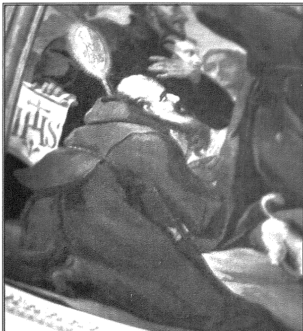
Ix-xbieha fl-Arzella tal-Kappellun tar-Rużarju

issir il-festa tiegħu. Kien hemm ukoll fratellanza tal-Madonna tal-Karità li wisq probabbli giet ispirata minn din id-devozzjoni għall-fatt li dan il-qaddis fl-ikografija tiegħu dejjem iġibuh bil-kelma Caritas maġenb il-bastun li jkollu f'idu. Sa ftit snin ilu fil-kunvent kien hemm ukoll statwa tal-ġebel tal-qaddis imma għal xi raġuni din l-istatwa spiċċat fil-ġnien tal-knisja ta' Bir id-Deheb. Hasra li din l-istatwa spiċċat hemm taqla' fuqha l-elementi tan-natura. Xbieha oħra ta' dan il-qaddis tinsab fl-arzella tal-kappellun tar-Rużarju fil-knisja parrokkjali u fi kwadru iehor fl-Istitut ta' Ġesù Naz-zarenu.