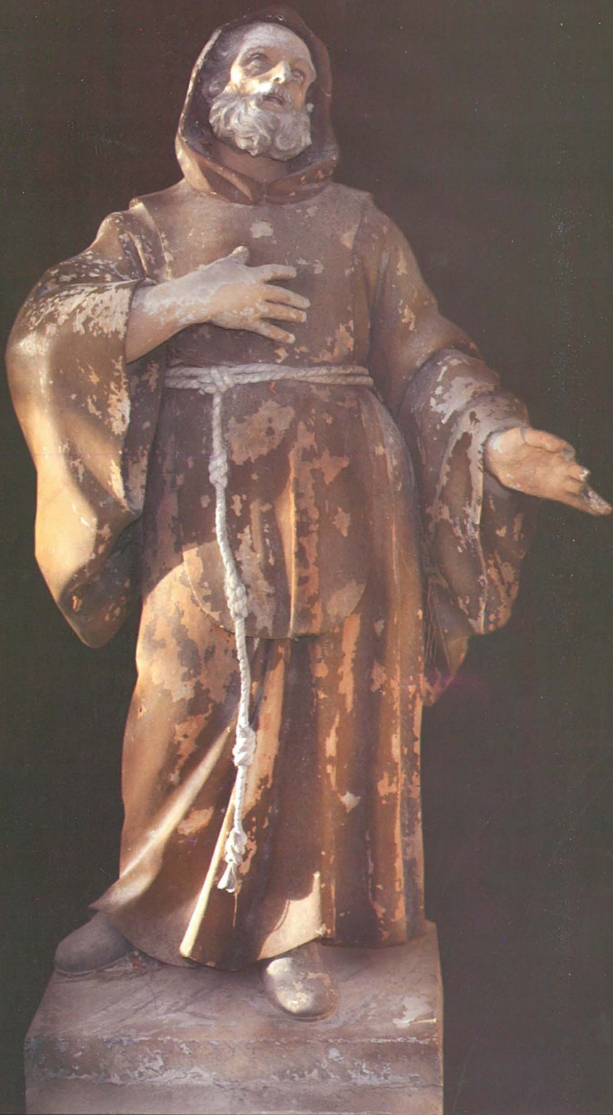
Statwa tal-Ġebel li qabel kienet fil-Kappella tal-Ispirtu s-Santu u llum tinsab fil-bitha tal-Knisja tal-Fniena - Bir id-Deheb.