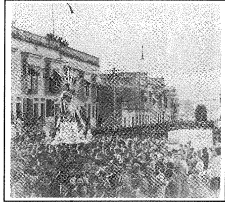
Il-Vara tal-Kuncizzjoni fit-tarf ta' Fler-de-lyo fil-Pellegrinagg storiku tad-19 ta' Novembru 1944.