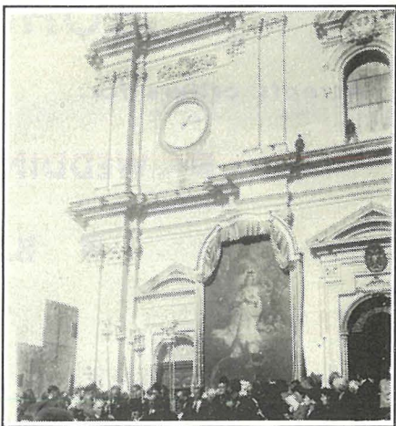
Il-kwadru tal-kor hareġ mill-Bazilika ta' B'Kara nhar id-19 ta' Novembru 1944 fis-1.15 p. m. fi triqtu lejn Bormla.