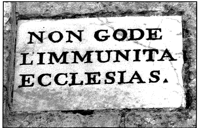
Aħna l-ulied tal-progress u l-informatika ftit li xejn nistgħu nifhmu x’missjoni kellha din il-lapida li kienet ferm komuni mal-kappelli tal-kampanja! Id-dehra tagħha llum, tfakkarna fiż-żmien li għadda u mar biex qatt iżjed ma jerga’ jiġi lura.

“Din mhix hliet twissija għall-kriminali li jkunu għamlu xi delitt, ... kull delinkwent li jkun wettaq delitt, jekk imur jiġri lejn il-knisja u jidhol jistkenn hemm ġewwa fiha, il-ġustizzja ma tistax għalih. Mhux biss,