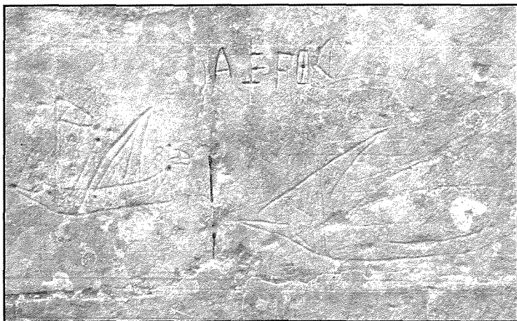
Dawn is-simboli ta' xwieni mnaqqa fil-hajt, huma xhieda ta' wegħdi magħmula minn bahhara Insara ta' żmien l-Ordni. Dawn il-graffiti jipogġew mal-kategorija 'ex voto' u llum jagħmlu sehem mill-patrimonju tagħna l-Maltin.