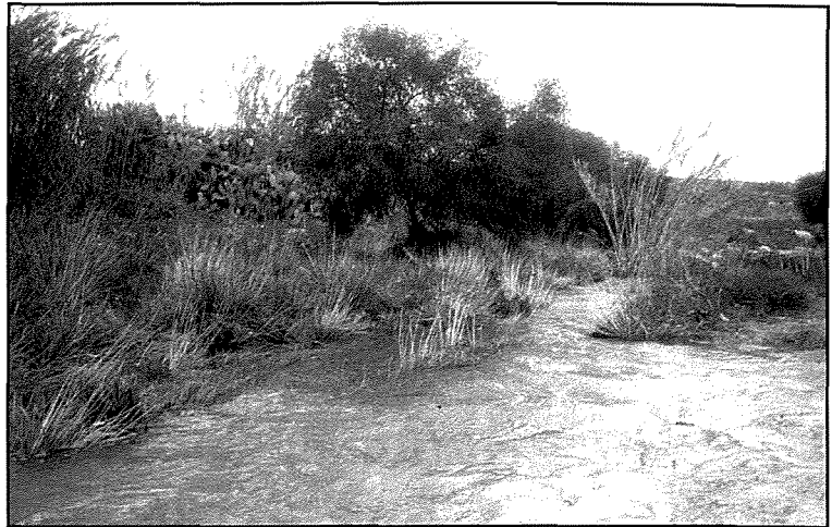
Matul ix-xitwa u r-rebbiegħa, wieħed għadu jista' japprezza s-seher ambjentali li jirrenja f'Wied il-Qlejgħa u l-inħawi li jdawruh. Dan hu l-wirt għażiż li jixraqlu kull protezzjoni minna lkoll.