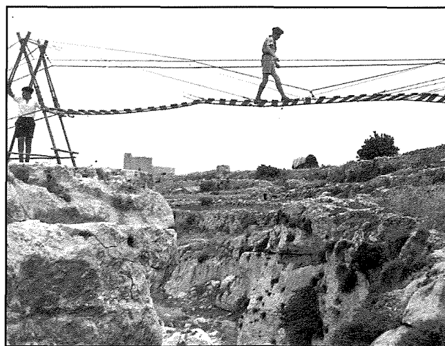
Fl-imghoddi l-Iskawts tal-Mosta kienu jwettqu sezzjoni ta' taħriġ bil-ħbula billi jiffurmaw pont li jaqsam minn xaqliba għall-oħra ta' Wied Hanzira. Dak ir-raġel li jidher jaqsam il-pont mhu ħadd ħlief missieri!

Filwaqt li l-inhawi ta' madwar il-kappella huma magħrufa bhala 'Tal-Mingiba', il-wied li jghaddi jserrep hu msejjah 'Tal-Qlejgħa'. Ohrajn jghidulu 'Tal-Qlejja' jew 'Tal-Qliegħa'. Għalhekk isem il-wied iddakkar u twaħhad ma' l-istorja tal-kappella minhabba l-ilma li jghaddi minn biswit iz-zuntier tagħha. Dan il-wied