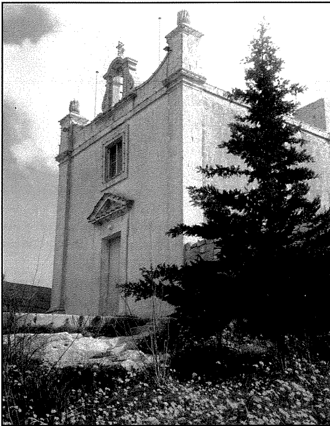
Il-kappella solitarja ta' San Pawl tinsab fl-inħawi pittoreski bejn ir-Rabat u l-Mosta. Il-beraħ tal-kampanja u l-wied li jgħaddi iserrep minn biswit iż-zuntier tagħha, joħolqu kartolina sbejħa.