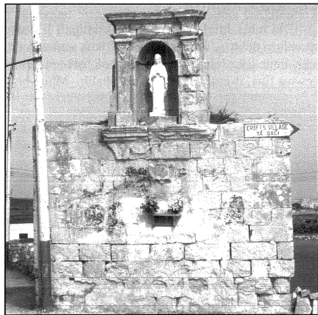
Din il-kamra qadima fl-inħawi 'Ta' Buqana', tiftaħ is-separju għal xenarju mill-isbaħ. Fuq is-saqaf tagħha tinsab niċċa helwa fejn fiha naraw statwa komuni tal-Madonna.