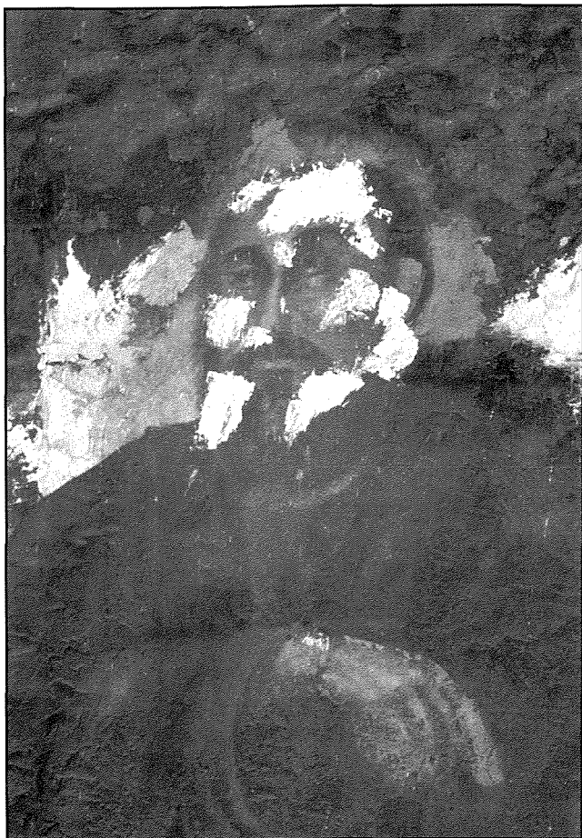
Il-kwadru titolari ġarrab diversi ħsarat matul is-snin li għaddew minn fuqu. Izda t-tbajja li sofra kawża ta' l-ilmijiet fil-maltempata ta' l-1979, huma ta' natura rreparabbli (dettal tal-wieċ).