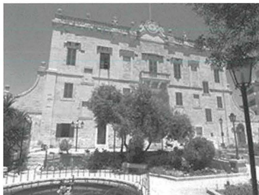
Palazzo Spinola, San Ġiljan

Id-dawra li għamilna flimkien mal-Gran Mastri tal-Ordni tal-Kavaleri ta' San Ġwann nistgħu ngħidu li ħaditna f'kull rokna ta' Malta u Għawdex. Lil Malta minn biċċa blata arida u vojta żviluppawha f'art il-ġmiel tagħha li għarfet iżżomm is-seher naturali tagħha filwaqt li żewqet dan ma' binjiet artistiki ta' valur kbir arkitettoniku li baqgħu għandna b'wirt mingħand dan l-Ordni glorjuż. Daqskemm is-salib bi tmien ponot, is-simbolu distintiv tal-Ordni ta' San Ġwann illum sar sinonimu ma' Malta, daqstant ieħor il-wirt imprezzabbli li ħallewlna dawn