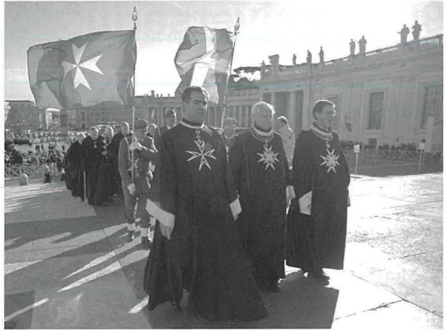
Ċelebrazzjonijiet tad-900 sena tal-Ordni ta' San Ġwann ġewwa l-Vatikan

It-titlu ta' Gran Mastru nsibuh jintuża għall-ewwel darba fl-1177 meta Fra Roger de Moulins assumma t-tmexxija tal-Ordni. 6 Il-kavallieri nġataw l-ilbies karatteristiku li jiddistingwihom sal-ġurnata mqaddsa tal-lum mill-Papa Alessandru IV fl-1259. 7 Hu tahom