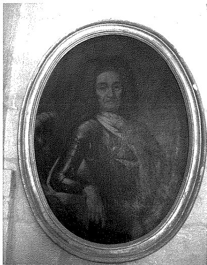
Kwadru tal-Kavallier Fra Paolo Raffaele Spinola fil-Kappella tal-Kuncizzjoni

L-ewwel knisja ddedikata lil San Ġiljan fl-inħawi fejn illum hawn il-parroċċa ddedikata lilu nbriet wara dik tal-Isla. Data preċiża tal-ewwel knisja m'għandniex. Papagiorcopulo (2008) 22 jirreferina għall-istoriku Achille Ferris li fil-ktieb tiegħu Descrizione Storica delle Chiese di Malta e Gozo jagħti l-1580 bħala d-data tat-twaqqif tal-ewwel knisja. Izda din hija data kkalkulata, miġjuba proabbilment mill-fatt li ma tissemma l-ebda knisja fil-Viżta Pastoral ta' Mons. Pietro Dusina tal-1575, filwaqt li tissemma għall-ewwel darba f'dik tal-Isqof Spanjol Tommaso Gargallo fl-1601, fejn jgħid li l-kappella nbriet m'hilix, sewwa sew fejn kien hemm il-knisja l-qadima . Hawnhekk m'ahniex se nidhlu fl-istorja tal-Knisja ta' San Ġiljan, izda biżżejjed ngħidu li jekk il-kavallieri ngibdu lejn dawn l-inħawi minħabba li kien tajjeb għan-namra tagħhom tal-kaċċa, dawn setgħu sabu din il-knisja zghira adattata għalihom biex iwettqu l-obbligi tagħhom ta' nsara. Probabbilment ikkontribwew ukoll biex tiżdied l-attività biswit din il-knisja u biex bdiet tiżviluppa l-lokalità nnifisha li allura gabet il-htieġa, matul is-snin ta' wara għall-bini u tkabbir ta' knejjes f'dan il-post. 23