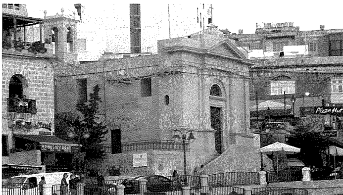
Il-Kappella tal-Immakulata Kuncizzjoni wara r-restawr li sarilha fuq barra

Sitt snin wara li nbriet il-kappella diġà kien hemm qassis residenti, Dun Martinu Cauchi, li kien iqaddes kuljum u jamministra s-Sagramenti mhux biss lill-Gran Prijur Spinola u lis-servitù li kellu, imma wkoll lir-raħħala Ġiljanizi. Wara Fra Paolo Raffaele, bħala rettur tal-fundazzjoni laħaq neputih Fra Giovanni Battista Spinola. Huwa ha l-pusses tal-fundazzjoni fit-