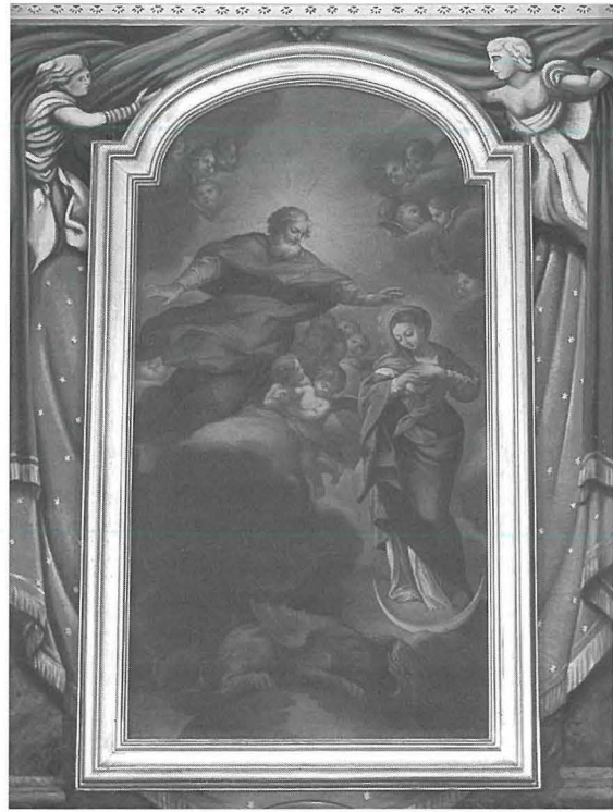
Il-Kwadru Titulari tal-Immakulata Kuncizzjoni

L-aħħar referenza għal Fra Giovanni Battista Spinola tinsab fil-viżta pstorali tad-19 ta' Marzu 1736 u f'inqas minn sena miet, fl-14 ta' Frar 1737. Mal-mewt tiegħu, id-dritt tan-nomina tar-rettur ma baqax iktar fil-familja Spinola. Infatti meta l-Isqof Bartolomeo Rull għamel il-viżta pastorali fil-Kappella tal-Kuncizzjoni fil-11 t'Ottubru 1758, ir-Rettur kien Dun