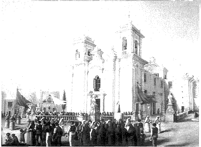
Pittura li turi l-Knisja Parrokkjali l-Antika ta' Sant' Andrija f' Hal Luqa.